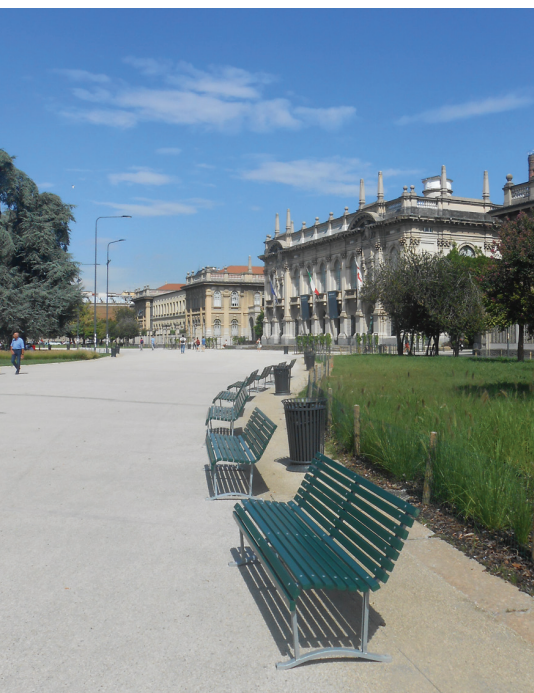
■ Piazza Leonardo da Vinci

La presenza di ampie superfici carrabili e pedonali in prossimità di un edificio porta ad un aumento della radiazione termica. E questo maggior calore solare nelle aree urbane è poi rilasciato gradatamente per irraggiamento, sotto forma di energia nell'infrarosso, con conseguente surriscaldamento dell'aria. Non si trattava di variare aiuole e vialetti quando calcolare a priori come sarebbe mutato il clima eliminando decine di alberi .