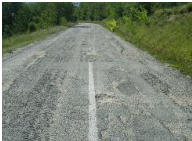
Strada dissestata a Sant'Angelo in Vado

pensi ad uno sviluppo armonico del territorio nel quale risiedono? Non si tratta di fare considerazioni economiche dettagliate tra costi e benefici di ogni singolo tratto di strada in costruzione, o in progetto, ma è sufficiente analizzare i dati dei due comparti citati: quelli che il CENSIS definisce in un caso «poli della logistica» e nell'altro «territori dell'accoglienza».