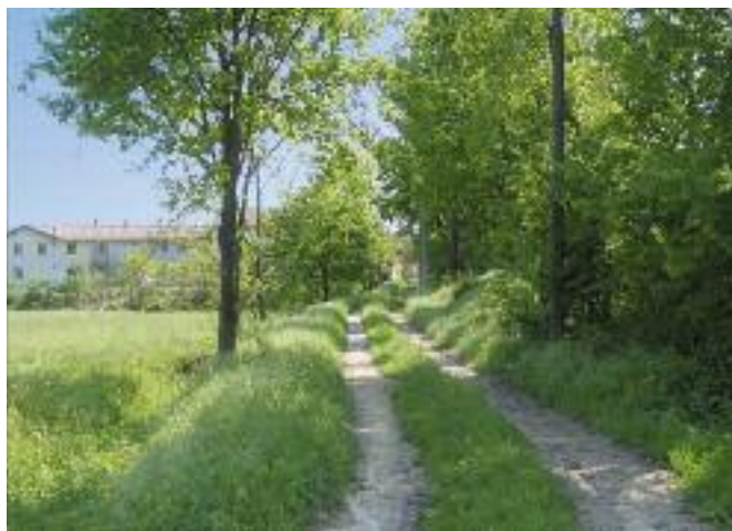
Tracciato della Via Francigena nei pressi di Casalpusterlengo