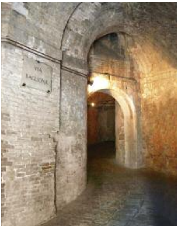
Strada coperta nella Rocca Paolina a Perugia

Se la costruzione di nuove tratte autostradali agevola gli spostamenti di lungo raggio è altresì fuori discussione che questi nuovi tracciati siano in larga parte voluti per agevolare i traffici commerciali. La domanda da porsi è quindi relativa agli scenari di sviluppo che il Governo desidera, nella matematica certezza che ad ogni azione corrisponda sempre uno scenario che sarà tanto più differente quanto maggiormente diversi saranno i fattori che lo possono determinare. Quanti italiani - oggettivamente - desiderano che strade della propria regione si configurino come un «corridoio» europeo per il traffico merci? E quanti italiani - invece - sarebbero assai più pro-