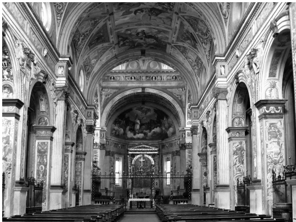
7. Cremona, San Sigismondo, l'interno.

Con grande probabilità dovremo concludere che la maggior parte degli alzati e della loro articolazione, come la vediamo oggi (fig. 7), rispondano a un momento molto successivo alla fondazione, in seguito alla decisione del Mo-