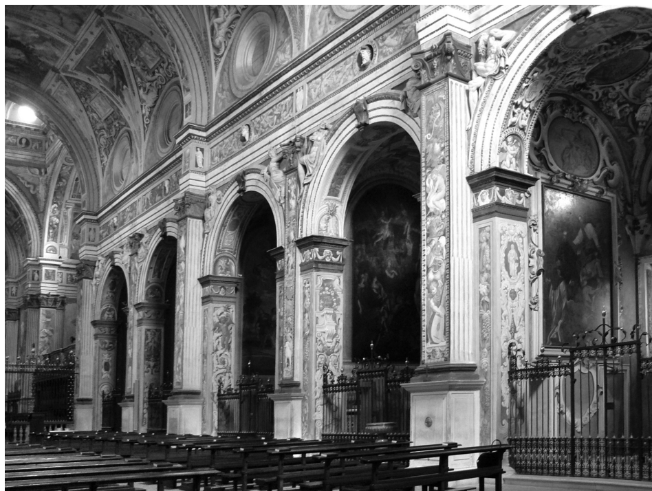
6. Cremona, San Sigismondo, alzato interno della navata.

compiuti e potessero accogliere una parte dei trenta monaci contemplati nel testamento della duchessa, seppure quasi sicuramente il chiostro e il refettorio non furono perfezionati, come abbiamo visto, fino ai primi anni del Cinquecento. Molti sono gli anni di vuoto documentario, durante i quali si riesce però a intendere che del cospicuo lascito disposto da Bianca Maria i monaci non riuscirono a ottenere nulla e continuarono a reiterare suppliche per ricevere il corrispettivo dovuto. Come aveva già ipotizzato Maria Luisa Ferrari, probabilmente nel lasso di tempo che va dal 1468 almeno alla seconda metà degli anni ottanta, quando si hanno le prime notizie di un interessamento da parte di Ludovico il Moro, la costruzione della chiesa dovette andare a rilento. Si ricorda a questo punto che la pietra di fondazione rinvenuta nelle fondamenta della facciata reca la data 1492, segno che la navata poteva aver raggiunto a questa altezza cronologica il limite della fronte dell'edificio 101 . Dal vaglio della docu-