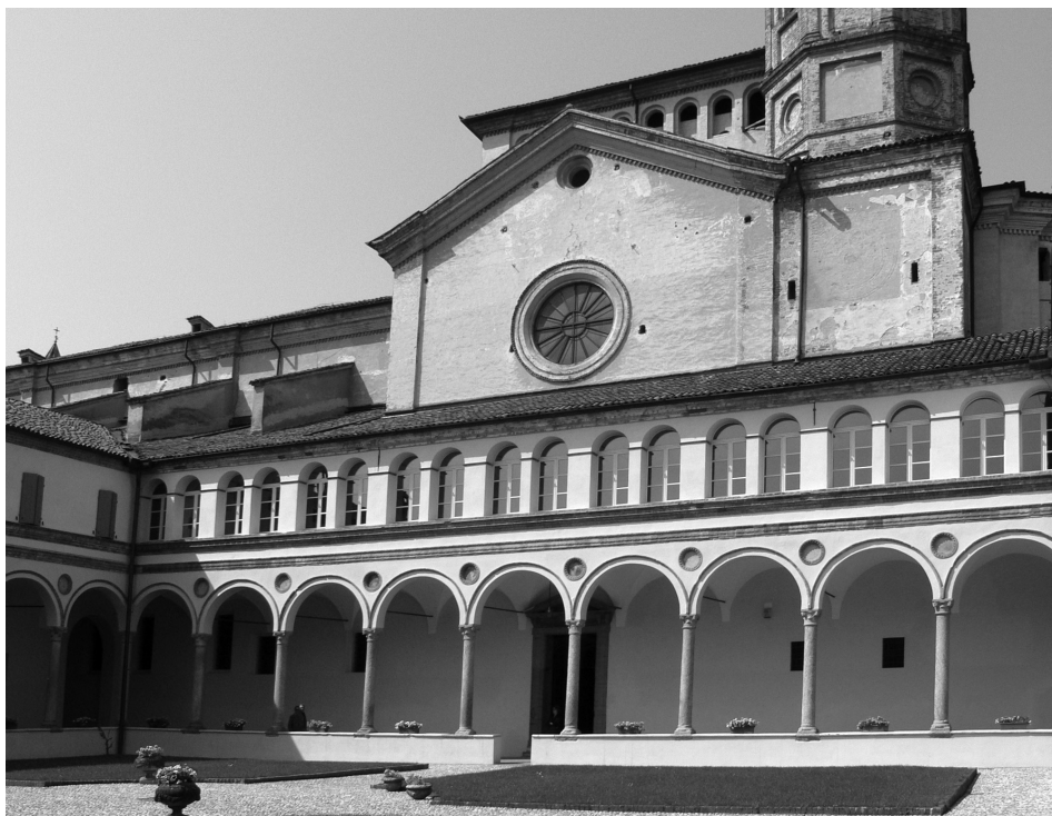
5. Cremona, San Sigismondo, lato nord del chiostro con testata dello pseudotransetto.

vanni Antonio Sacca compare nel 1508 in due note distinte: il 9 e il 26 agosto per l'acquisto di assi di pino 93 , mentre su maestro Evangelista sorgono alcuni dubbi. La prima perplessità concerne il fatto che nei primi anni del Cinquecento compare un Evangelista da Rondo, la prima volta il 24 marzo 1504 e poi ancora nell'aprile e nel maggio dello stesso anno 94 , mentre a partire dal 1509 95 troviamo un maestro Evangelista Roncho, difficilmente identificabile