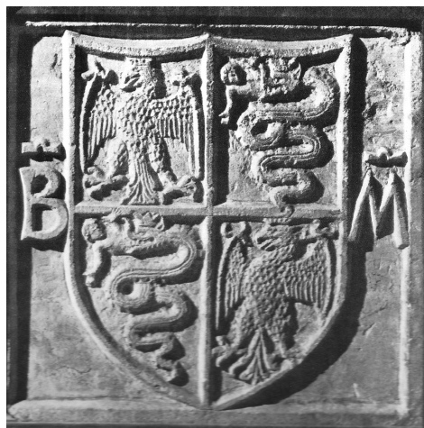
2. Cremona, San Sigismondo, pietra di fondazione con le iniziali di Bianca Maria Visconti. (da Ferrari, 1974)

Il 20 giugno 1463 si pose quindi la prima pietra del nuovo edificio, collocata nella zona dell'altare 5 , una vera e propria lapide dedicatoria (figg. 2-3), avente da un lato le immagini dei santi Sigismondo, titolare dell'edificio, e Girolamo,