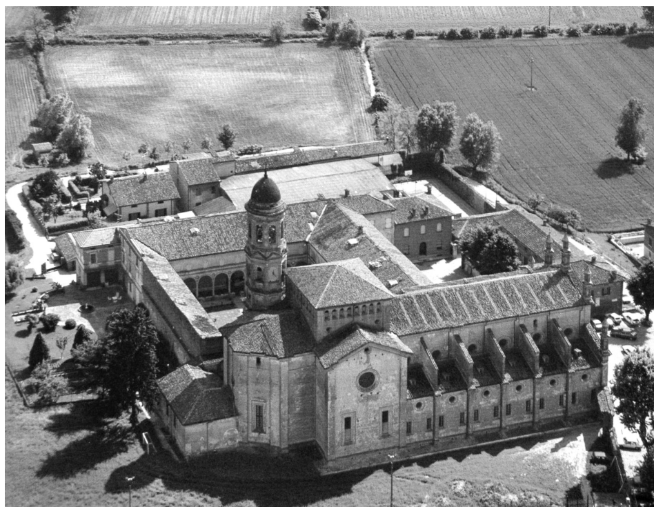
1. Cremona, San Sigismondo, veduta aerea. (da M. Brignani, L. Briselli, L. Roncai, Un giardino nell'Europa: la provincia di Cremona , Persico Dosimo 2005)

Le complesse vicende relative alla costruzione della chiesa di San Sigismondo di Cremona (fig. 1) e i caratteri del monumento consentono di svolgere una riflessione a più livelli sulla cultura architettonica lombarda della seconda metà del XV secolo e dell'inizio del XVI. Potremmo considerare, infatti, questo edificio come una sorta di caso esemplare per l'architettura lombarda di quel periodo, costantemente diviso tra l'ossequio a una tradizione consolidata e il tentativo, a tratti più celato e a tratti più evidente, di aggiornamento del