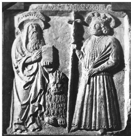
3. Cremona, San Sigismondo, pietra di fondazione con le immagini di San Girolamo e San Sigismondo. (da Ferrari, 1974)

DE VECCHI, Brevi cenni storici sulle chiese di Cremona che furono e che sono con aggiunta della successione dei MM. RR. Rettori che governa , Cremona 1907, pp. 182-192.