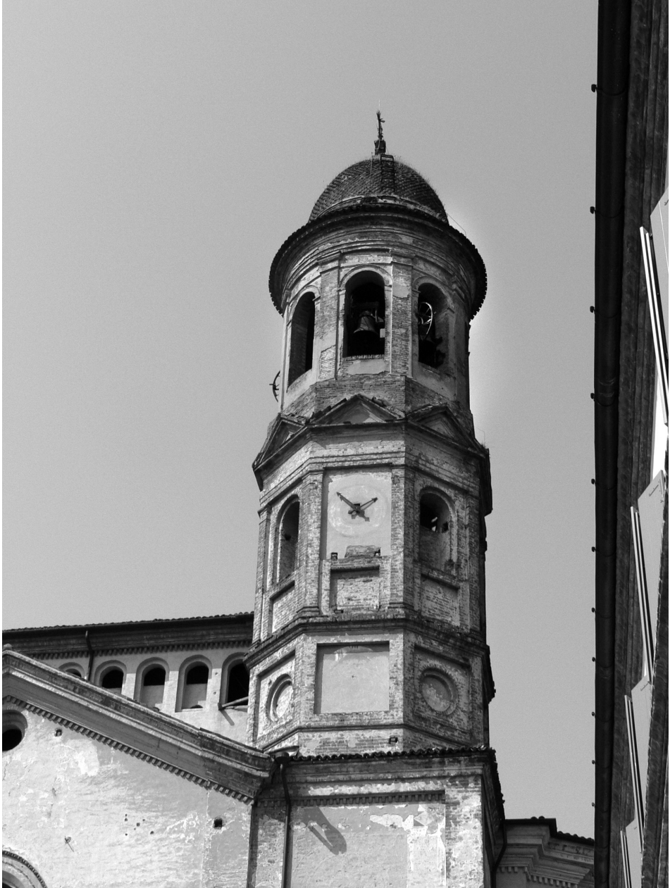
4. Cremona, San Sigismondo, il campanile.