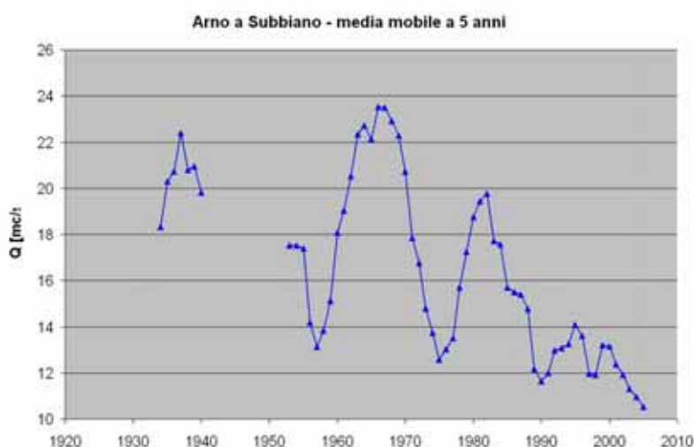
Figura 5. La dinamica del clima mostra elementi di variazione che sono sensibili già sulla scala temporale della decina d'anni. Il primo da segnalare è la rilevante diminuzione dei valori medi delle portate fluviali che, oltre all'Arno, riguarda buona parte dei grandi fiumi italiani.

Come dire, semplificando all'estremo, passare da un singolo fotogramma ad un film in continua evoluzione. Il tema è così complesso che richiederebbe ben altra trattazione.