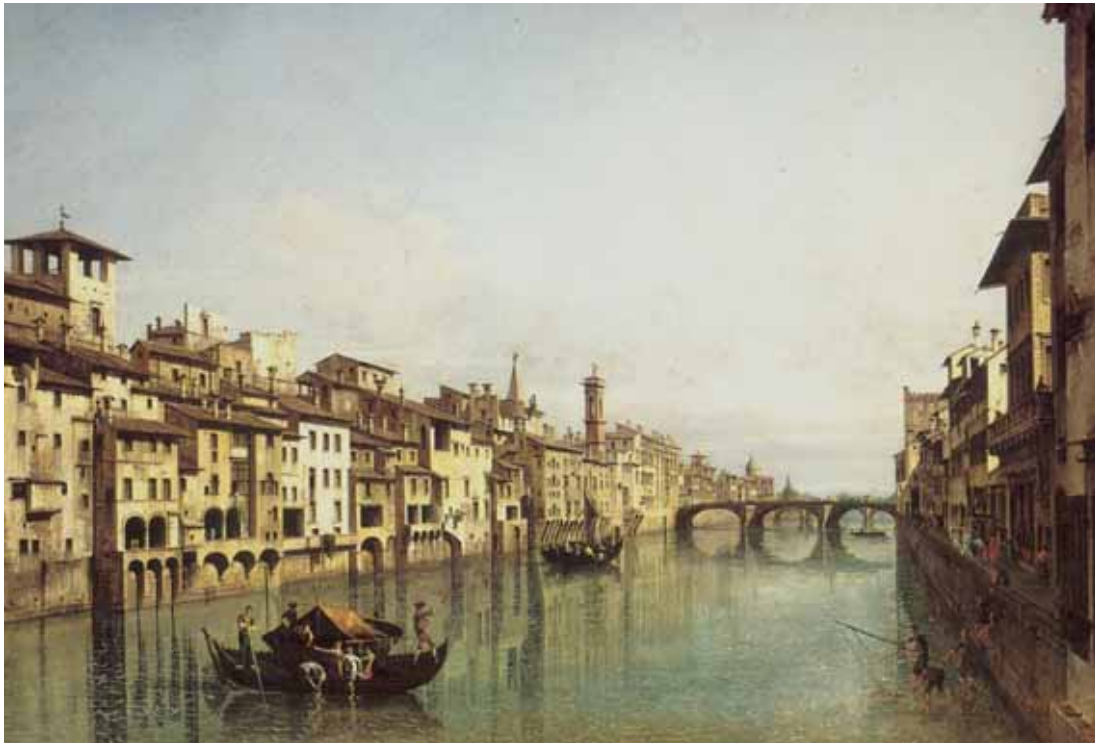
Figura 2. L'Arno e Firenze.

Il raffinamento di questa espressione, il quantum logico rispetto al passato, è determinato dal lavoro della Commissione interministeriale “De Marchi”, costituita all’indomani del tragico evento del 1966 e che pubblica il proprio rapporto conclusivo il 30 giugno 1970. La politica della difesa del suolo, in sostanza, può avere successo solo se attuata attraverso l’attività di pianificazione e di programmazione svolta alla scala dell’intero bacino idrografico, transcendendo idealmente i tradizionali limiti amministrativi di Comuni, Province e Regioni e inquadrando i problemi in una visione olistica che superi i singoli aspetti specifici.