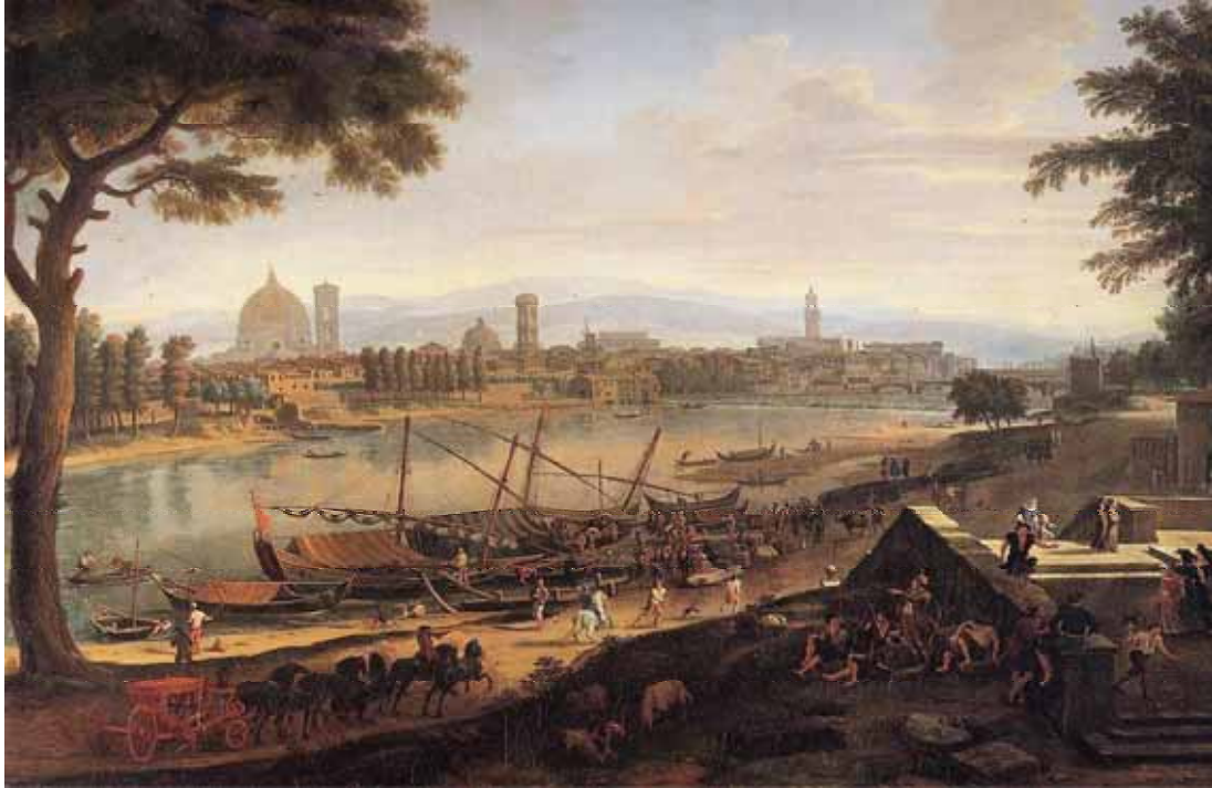
Figura 1. L'Arno a Firenze.