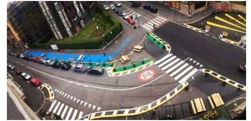
Fig.3 – The outcome of the #TrentaMi in Verde project

All this ferment is capturing the attention of private investors, ready to profit from the territory, so much so that real estate market experts foresee a future for NoLo similar to the recent past of the Isola neighborhood: a suburban area reborn thanks to the arrival of local and cultural centres and highly attractive for the real estate market.