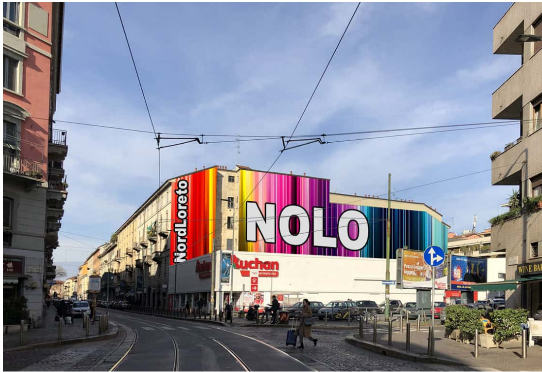
Fig. 4 – The “brand” NoLo on a mural in the neighbourhood

In fact, with awareness or not, NoLo is becoming an easy way to enter building speculation to the detriment of the poor and disadvantaged classes, preparing to contribute to the development of the gentrification process, disguised as an intervention for the redevelopment and regeneration of the territory. In reality, is advancing the transformation of the use of housing and social spaces which undermines lifestyles that seemed consolidated, characterized by solidarity and multi-ethnic and multicultural relations [13]. These are the first signs of gentrification represented by urban, building, economic and socio-cultural environmental changes and gradually of other nature, of which the weakest part of the population, from all points of view, is excluded, or in the best-case scenario, it becomes a passive spectator [14, 15].