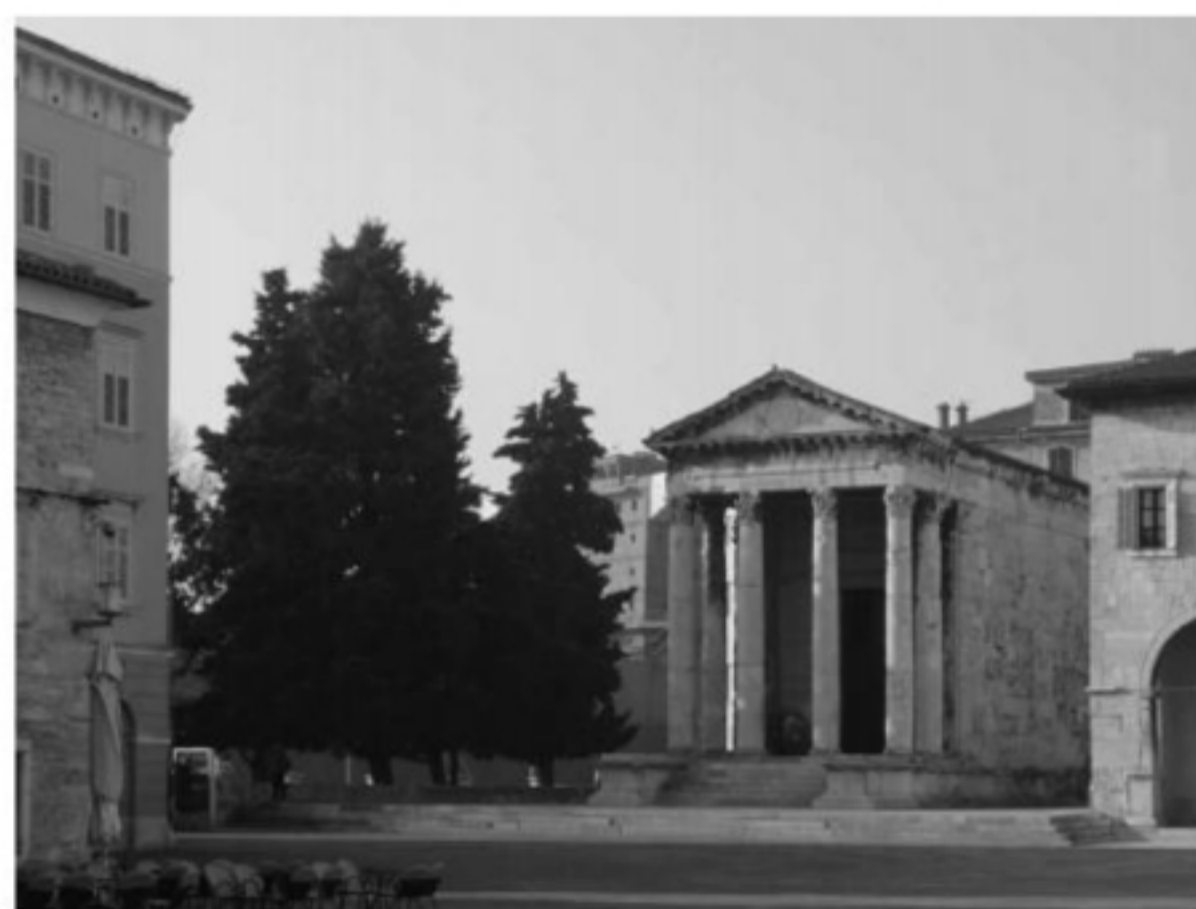
Fig. 4 La Palazzina comunale a Pula a seguito dei bombardamenti; a fianco si nota il cantiere di messa in sicurezza del Tempio di Augusto (Archivio dell'Arheološki muzej Istre).