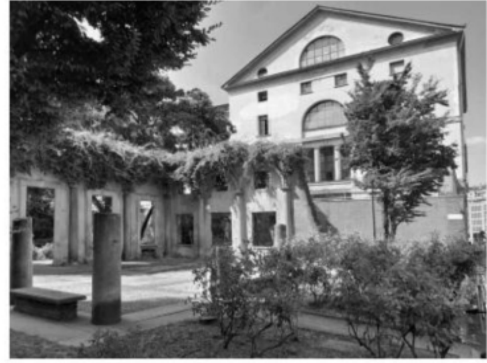
Fig. 2 Sistemazione a verde di area bombardata, fra via Molino delle Armi e via Campo Lodigiano, a Milano (fotografia di G. Pertot, 2021).