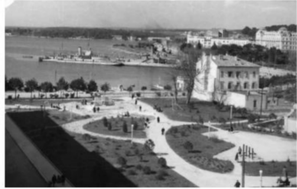
Fig. 6 Sistemazione a verde dei dintorni della Cappella di Santa Maria Formosa a Pula nel 1957.