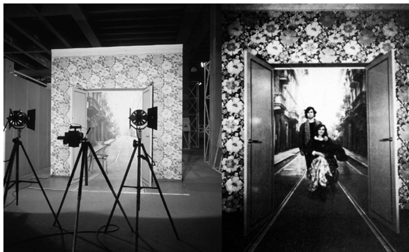
Fig. 1 – Interno-esterno, installazione alla Triennale di Milano, 1979

momenti storici, ma dell'affiorare simultaneo di un insieme di modelli sociali che trovano nel rifiuto del modello tradizionale della famiglia un comune denominatore.