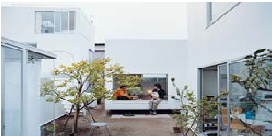
Fig. 4 – MoriYama House, SANAA / Kazuyo Sejima & Ryue Nishizawa, Tokyo, 2005

Fonte: © SANAA / Kazuyo Sejima & Ryue Nishizawa