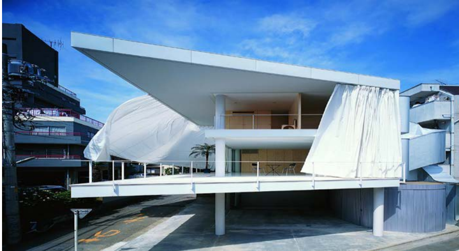
Fig. 3 – Curtain Wall House, Shigeru Ban, Tokyo, 1995