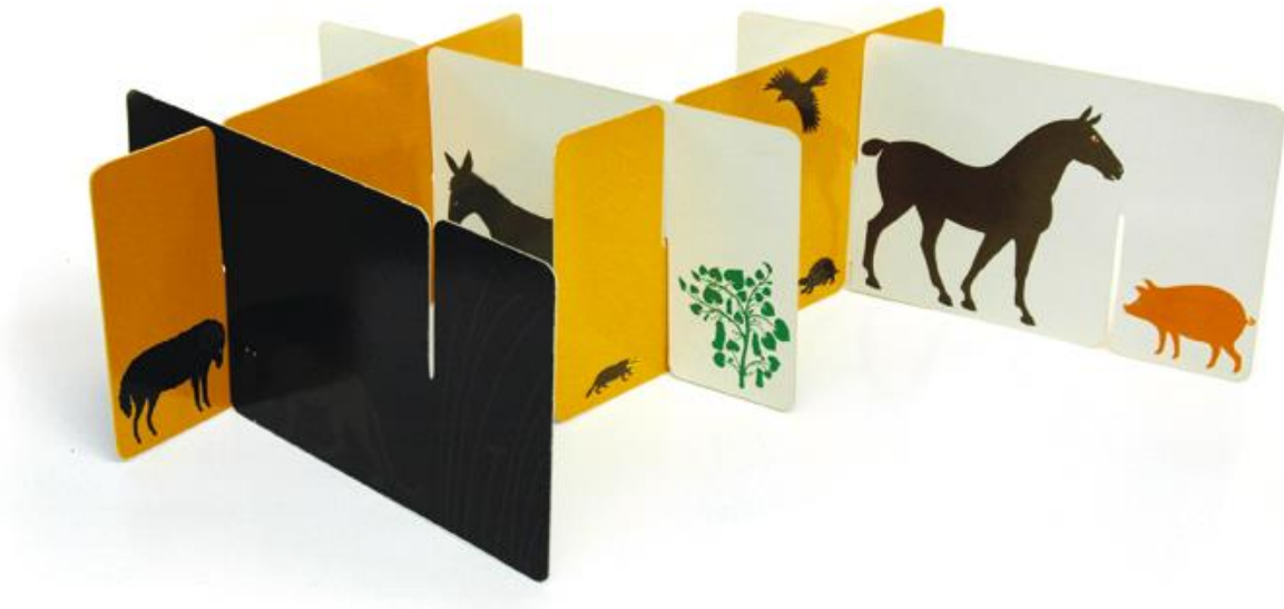
Figura 1 - Enzo Mari, O jogo do conto de fadas