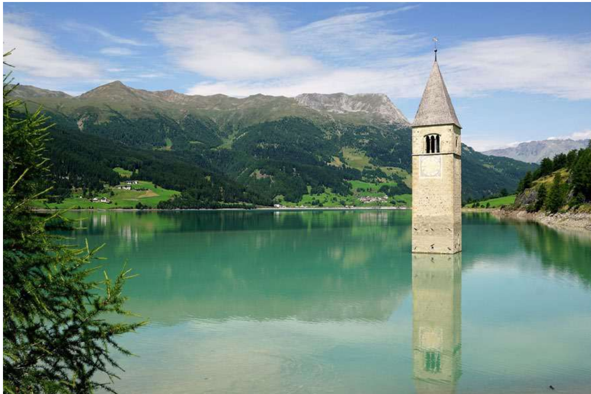
Figura 2. Curon (Bolzano). Ciò che resta dell'antico borgo, sommerso nel 1950 dal lago artificiale di Resia. L'iconico campanile che emerge dal lago è oggi una delle attrazioni del nuovo omonimo abitato, costruito più a monte, dove la popolazione fu obbligata a spostarsi, https://www.maxpixels.net/photo-2612296 (ultimo accesso 18 settembre 2020).