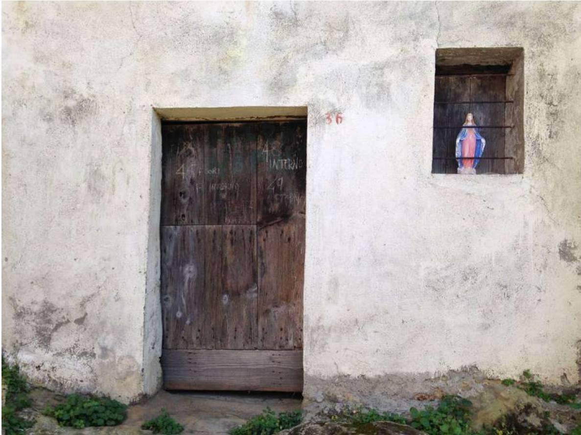
Figure 3. Ferruzzano (Reggio Calabria), view of the entrance of an abandoned building (photo N. Sulfaro, 2019).

On the next page, figure 4. Ferruzzano (Reggio Calabria), view of an abandoned house interiors (photo N. Sulfaro, 2019).