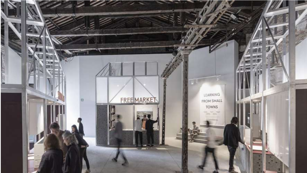
Figure 4. Free Market: the Irish pavilion at La Biennale di Venezia 2018 (photo M. Thompson, 2018).