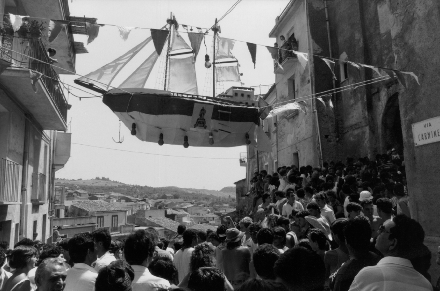
Figura 3. Gioiosa Jonica (Reggio Calabria). Festa di San Rocco (foto V. Teti, 1986).