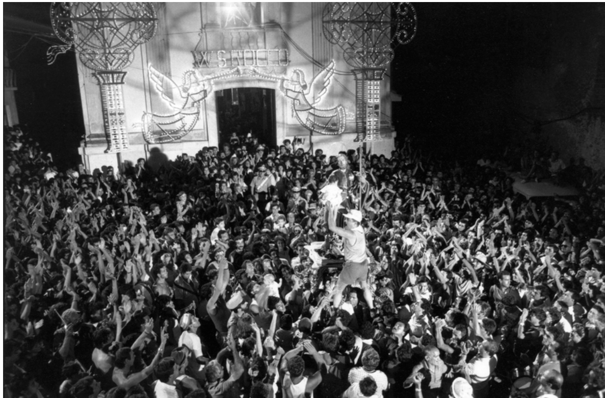
Figura 6. Gioiosa Jonica (Reggio Calabria). Festa di San Rocco.