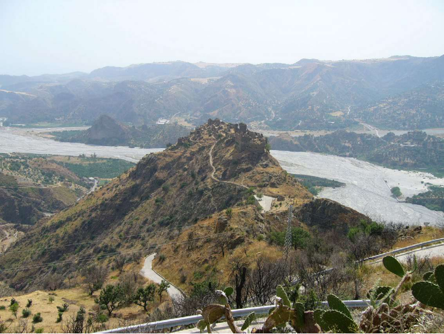
Figura 3. Amendolea Vecchia (Reggio Calabria). Il borgo antico sullo sfondo dell'omonima fiumara. Gli ultimi abitanti del paese, già spopolato, dopo l'alluvione del 1956 furono trasferiti nel nuovo piccolo borgo ricostruito ai piedi della rocca, https://mapio.net/images-p/17861057.jpg (ultimo accesso 18 settembre 2020).