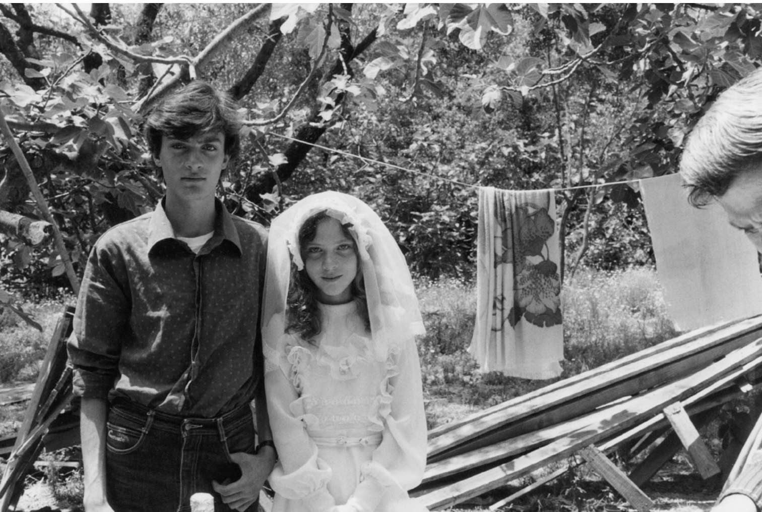
Figura 7. Campagne di San Nicola da Crissa (Vibo Valentia) (foto V. Teti, 1985).