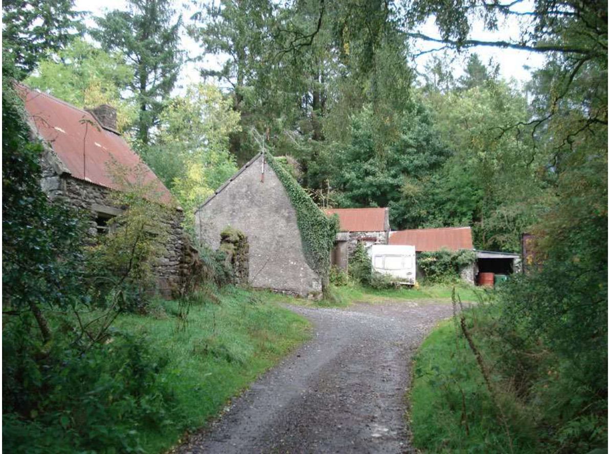
Figure 1. The remnants of “the city”, Nire Valley, County Waterford (photo L. Kealy, 2018).