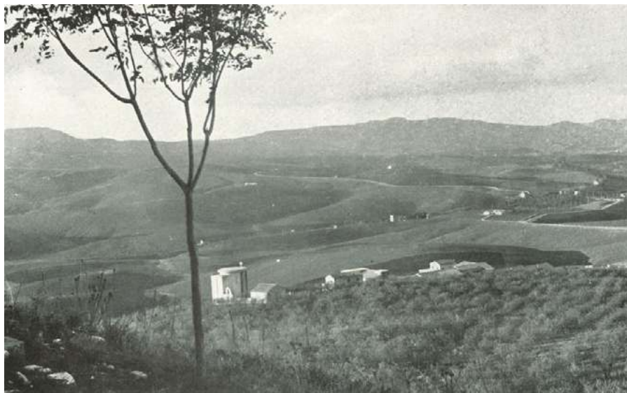
Figura 5. Borgo Gigino Gattuso (Caltanissetta) nel 1941, un anno dopo il completamento. Il borgo, progettato dall'architetto Edoardo Caracciolo, è uno degli otto centri rurali realizzati dal regime fascista in Sicilia (da AJROLDI 2020).

spersonalizzazione, alienazione e diserzione, in progettazioni monotone e ripetitive, prive di elementi di riconoscibilità o poli aggregativi identitari. Esiste un'ampia casistica di insediamenti abbandonati già poco dopo la loro fondazione, magari ancor prima di venire ultimati sul piano edilizio, quelli che in tedesco vengono detti Fehlsiedlungen , "insediamenti mancati", incapaci di attrarre un numero sufficiente di abitanti o progettati tenendo in maggior conto i caratteri celebrativi piuttosto che quelli funzionali.