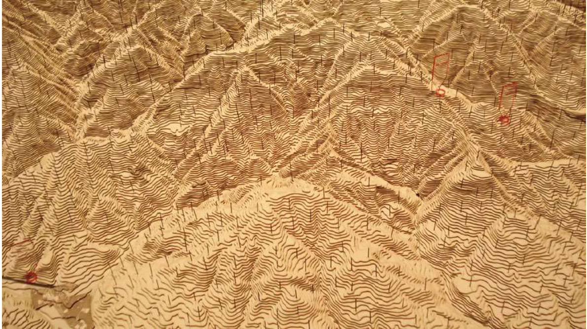
Figure 3. A selected element of the Italian pavilion at the 2018 Venice Biennale, Archipelago: Borghi of Italy.

change 22 . Many might suggest that this is not so – that the forces of economic change are beyond local endeavour. And yet, this is precisely what the new, countervailing narrative is putting forward, albeit in a more sophisticated framework. Kavanagh’s words carry a powerful and subtle message: