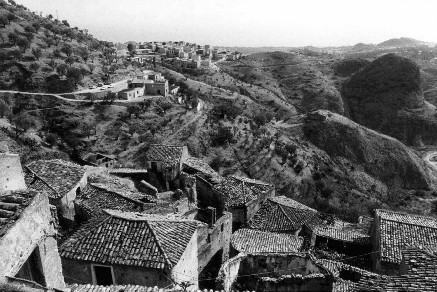
Figura 9. Pentadattilo (Reggio Calabria).