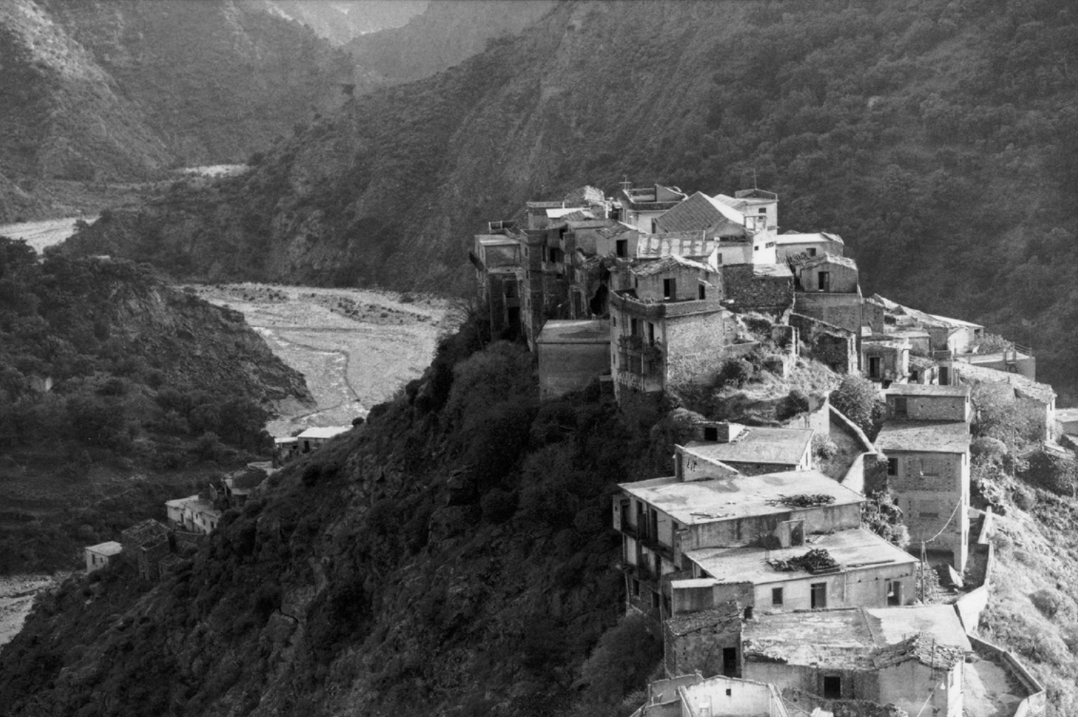
Figura 5. Roghudi (Reggio Calabria).