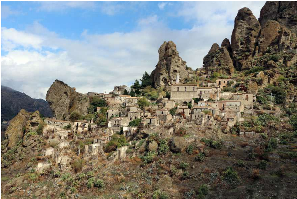
Figura 6. Pentadattilo (Reggio Calabria). Veduta.