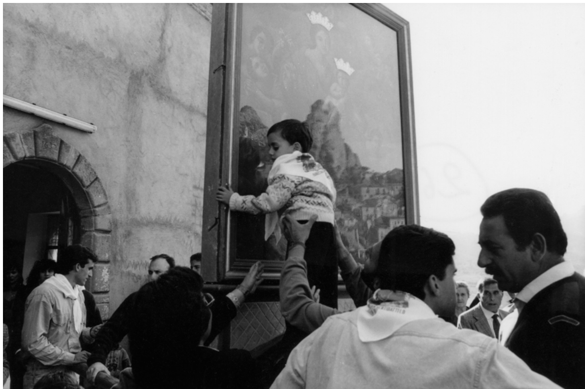
Figura 8. Pentedattilo (Reggio Calabria).