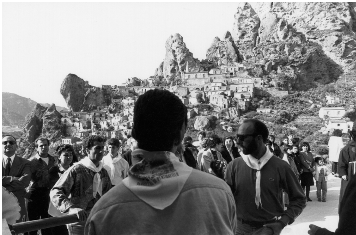
Figura 1. Pentadattilo (Reggio Calabria). Madonna di porto Salvo (foto V. Teti, 1994).