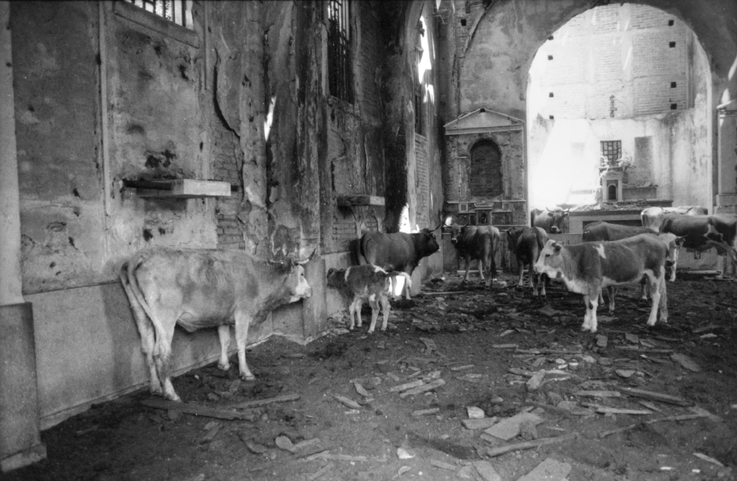
Figura 2. Africo Vecchio (Reggio Calabria).