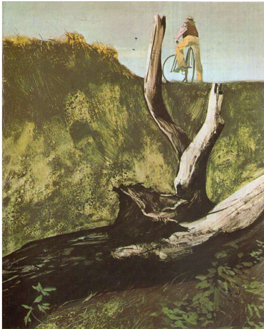
Figura 2. Mario Tempesti, illustrazione per la copertina dell'edizione di La luna e i falò del 1964 (da C. PAVESE, La luna e i falò , Oscar Mondadori, Milano 1964).