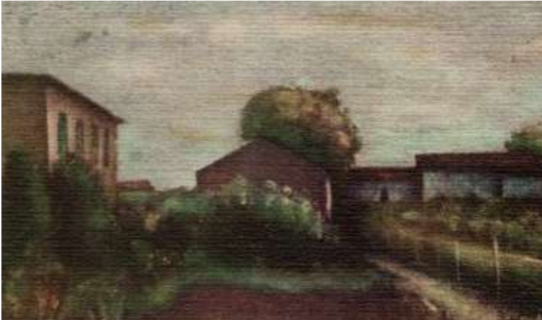
Figura 1. Carlo Carrà, Orti Toscani (1928), particolare dell'illustrazione per la copertina dell'edizione di La luna e i falò del 1950 (da C. PAVESE, La luna e i falò , Einaudi, Torino 1950).

Questo richiamo all'onomastica è per accennare ad un ripetuto sondaggio in occasione degli esami di Analisi della città e del territorio , corso che ho tenuto al Politecnico di Torino dopo il trasferimento dallo IUAV. Grandi città ed aree metropolitane in Italia 4 di Alberto Aquarone, uno dei testi da presentare, tratta approfonditamente il caso torinese e così offriva spunti per fare riferimenti alle vicende migratorie dei nuclei familiari originari: da quali località del Nord Est provenivano, in che anni e per quali ragioni le avevano abbandonate; in quali zone del Piemonte erano approdate e successivamente si erano spostate; quali i mestieri a seconda delle occasioni di lavoro in una fase di intensa crescita economica e così via: in altre parole se erano andati oltre le pagine del libro per cogliere dal vivo la grande ondata migratoria che aveva investito il Piemonte nel Secondo dopoguerra.