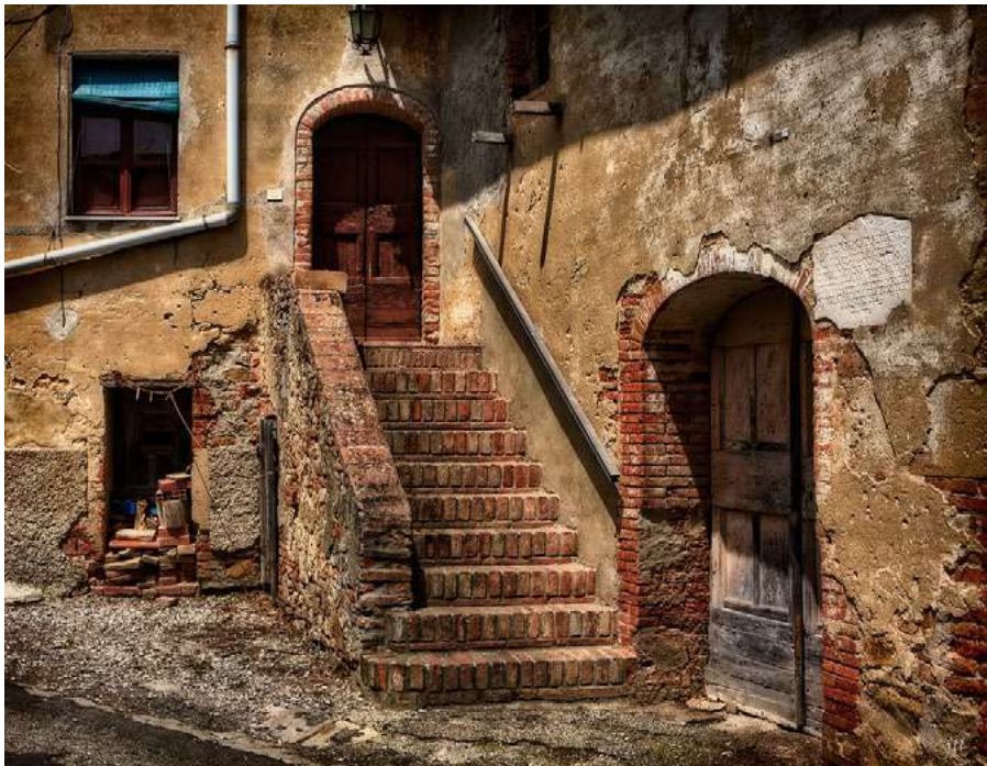
Figura 4. Toiano (Pisa). Il borgo, oggi attualmente spopolato iniziò la sua decadenza nel XIX secolo. Il borgo oggi è noto, grazie all'iniziativa di Oliviero Toscani che gli dedicò un concorso fotografico, finalizzato alla sua valorizzazione, https://www.visittuscany.com/shared/visittuscany/immagini/blogs/idea/toiano.jpg (ultimo accesso 18 settembre 2020).

umane “programmate” – eventi bellici, politiche di gestione del territorio, fragilità socio-economiche – indicandone quindi l’incidenza sugli andamenti demografici. Si tratta, però di una generalizzazione statistica che, pur capace di dare immediatamente un quadro chiaro e inequivocabile delle dimensioni del fenomeno, appare non del tutto adeguata alla sua comprensione. È evidente, infatti come non è possibile ricondurre il tutto a una singola causa, per quanto incidente possa apparire, così come non è possibile ragionare su una “policasualità orizzontale” 14 , che non tenga conto del momento di innesco e dell’evoluzione delle singole dinamiche, oppure che trascuri le specificità delle tipologie insediative e dei rapporti geo-storici locali.