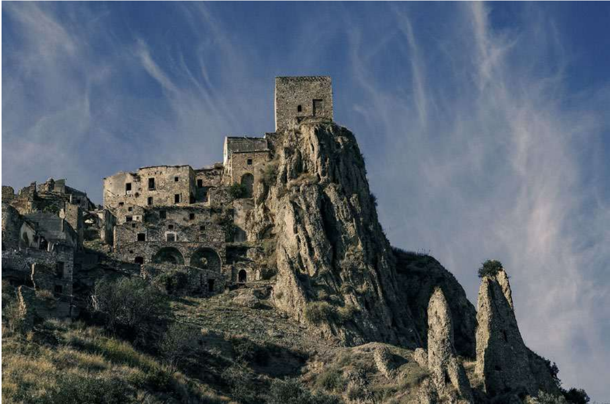
Figura 1. Craco (Matera). Il borgo, svuotatosi a causa di una frana negli anni sessanta del Novecento, è una delle immagini-simbolo dell'abbandono dei borghi storici, https://www.maxpixels.net/photo-3199111 (ultimo accesso 18 settembre 2020).