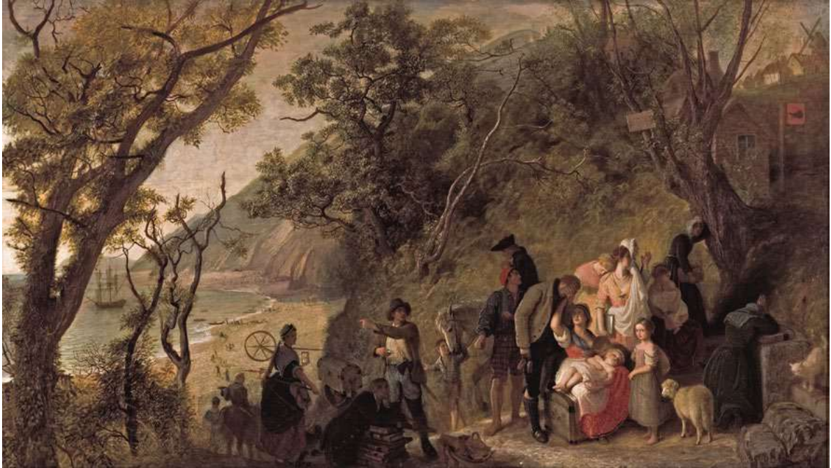
Figure 2. Joseph Severn (1793-1879) The Deserted Village , oil on canvas laid on wood, Art Gallery of South Australia, https://commons.wikimedia.org/wiki/File:Joseph_Severn_-_The_deserted_village_-_Google_Art_Project.jpg (accessed 10 June 2020).

made through reorganisation of the agricultural economy: an expression of aesthetic melancholia as much as a critique of the undermining of the established life of rural settlements.