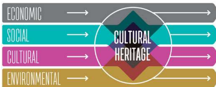
FIGURE 4.3. "UPSTREAM" PERSPECTIVE ON CULTURAL HERITAGE IMPACT SOURCE: OWN.