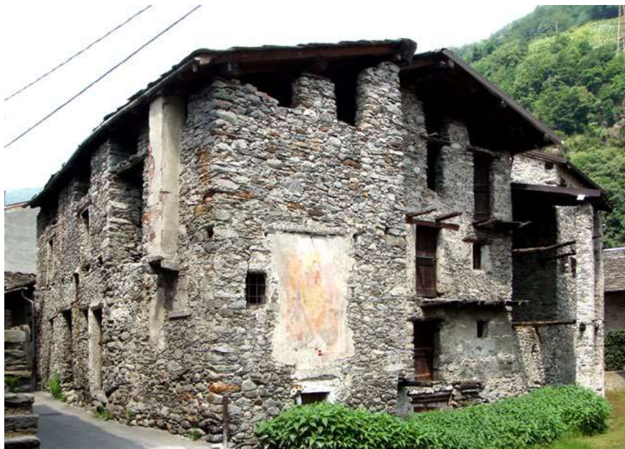
Figura 1. Ardenno (Sondrio), Case del nucleo al Piano.

adagiato nel fondovalle 8 . Qui le case sono rimaste vuote non per abbandono del luogo, ma perché tipologicamente obsolete. Quando l'Amministrazione comunale ci chiese un progetto per modificare le previsioni di piano, la nostra attività di ascolto attivo e partecipazione finì per verificare che il nucleo era riconosciuto come interessante, e come una opportunità progettuale, solo dalle élite e non dalla maggioranza degli abitanti. L'idea, di cui pur riconosco la banalità, di utilizzare le case abbandonate per una sorta di ostello diffuso, approfittando della opportuna collocazione rispetto ad un nuovo e strategico percorso ciclopedonale 9 , incontrò un generale scetticismo, salvo che in una ristretta cerchia di professionisti aggiornati, ovvero un imprenditore e il suo architetto di fiducia, che già avevano recuperato edifici analoghi per farne un agriturismo di successo, una vigna, e così via, sempre puntando su un marketing legato al concetto di autenticamente locale. Molti membri della