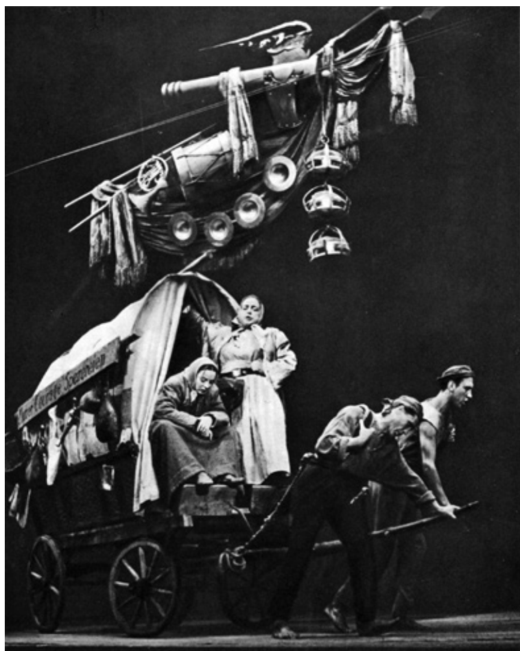
Bertolt Brecht, Mutter Courage und ihre Kinder (Madre coraje y sus hijos), 1938-39: puesta en escena de Bertolt Brecht en los Kammerspiele de Múnich, 1950.

los diferentes enfoques a la tipología con relación a la ciudad 9 : «Nuestro interés convergente en valorar el análisis tipológico se dirigía a la revisión crítica del Movimiento Moderno, en cuanto moralmente legitimada en una vanguardia originada por un