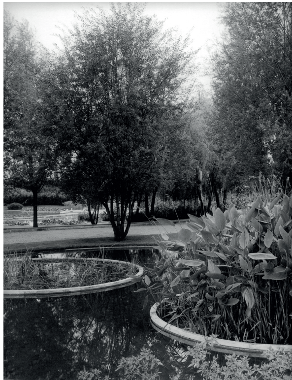
Fig. 3 Il Parco di Villa fiorita a Saronno di Pietro Porcinai, 1952-58

sono le dinamiche che presiedono alle trasformazioni e impongono una revisione radicale della dimensione etica e tecnica della progettazione.