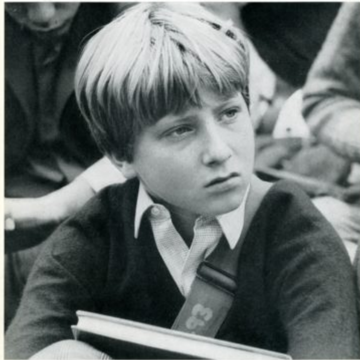
Fig. 8 - AG Fronzoni, copertina numero unico della rivista U , 1969.