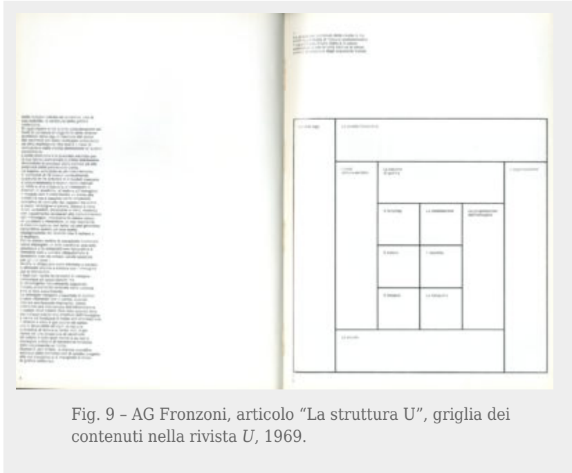
Fig. 9 - AG Fronzoni, articolo "La struttura U", griglia dei contenuti nella rivista U , 1969.

In occasione del lavoro di gruppo con gli studenti però si capisce che governa i contenuti insieme agli studenti e a un gruppo di docenti (Frisia, Perotti, Silvestrini, Tovaglia, Sansoni), sia nell'editoriale sia nell'articolo "La struttura U" (fig. 9), in cui si spiega la linea editoriale e redazionale dei futuri numeri, che si intende come: