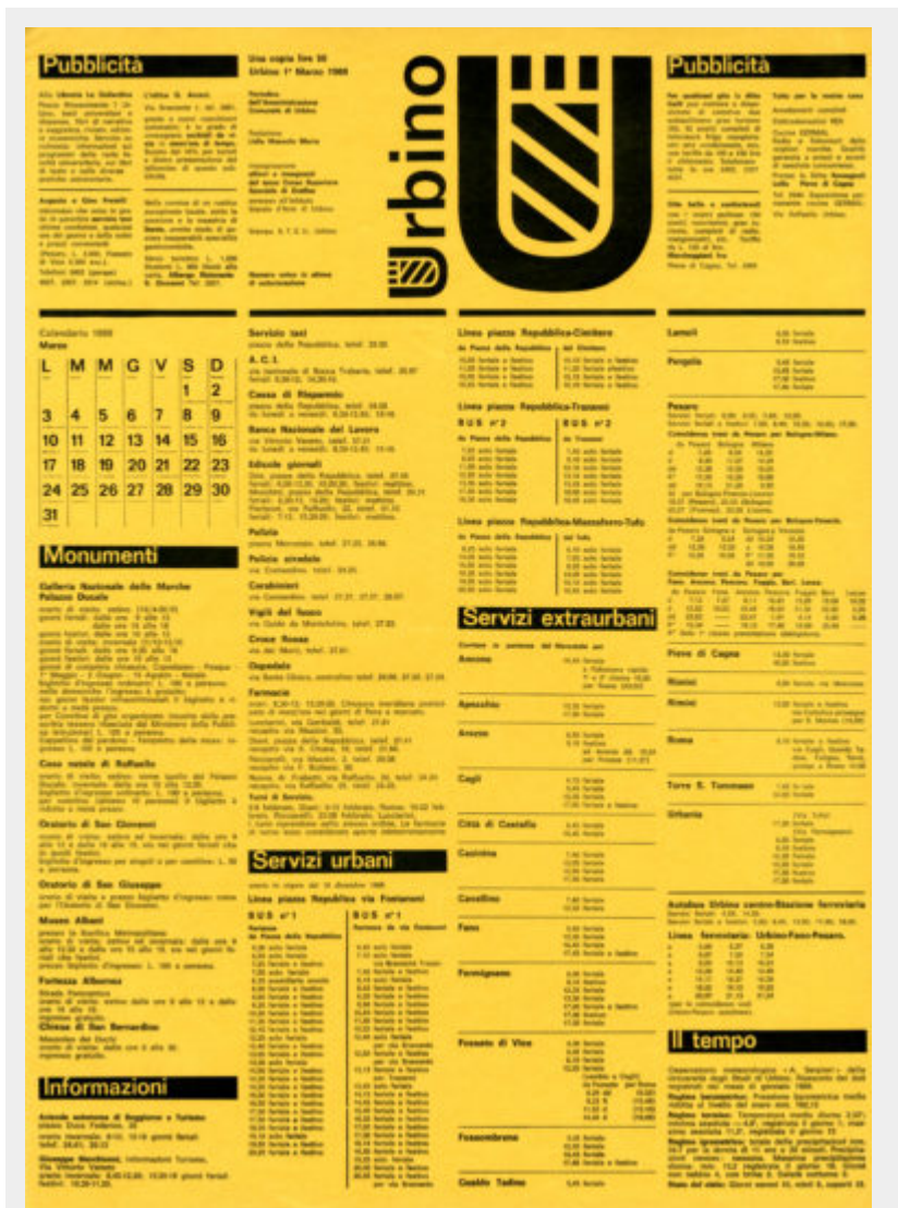
Fig. 5-6-7 - Albe Steiner, giornale U , 1969.

Se Il Politecnico con le sue idee, il contenuto degli articoli, le fotografie e le didascalie era un giornale che nasceva tutto insieme, proprio questa mobilità e questa pratica collettiva del lavoro sui contenuti testuali e visivi, si ripete ad Urbino intorno alla segnaletica prima e al giornale cittadino poi, Steiner cerca una nuova forma di comunicazione grafica, un nuovo “formato culturale” sul quale lui e gli studenti prima, e la cittadinanza poi si possano confrontare.