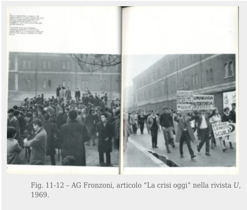
Fig. 11-12 - AG Fronzoni, articolo "La crisi oggi" nella rivista U , 1969.