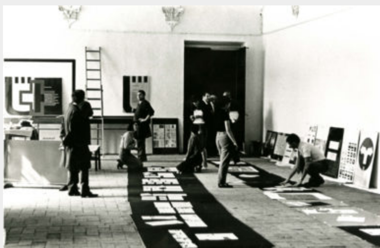
Fig. 3 - Albe Steiner, Mostra Convegno di lavoro Grafica e segnaletica in un centro storico , 1969.

L'immagine del Comune di Urbino è trattata come "un'unità divisibile", il metodo che Steiner adotta è lo "scomporre per poi ricomporre: suddivide l'insieme delle comunicazioni visive in sottoinsiemi" (Anceschi, 1984, p. 14).