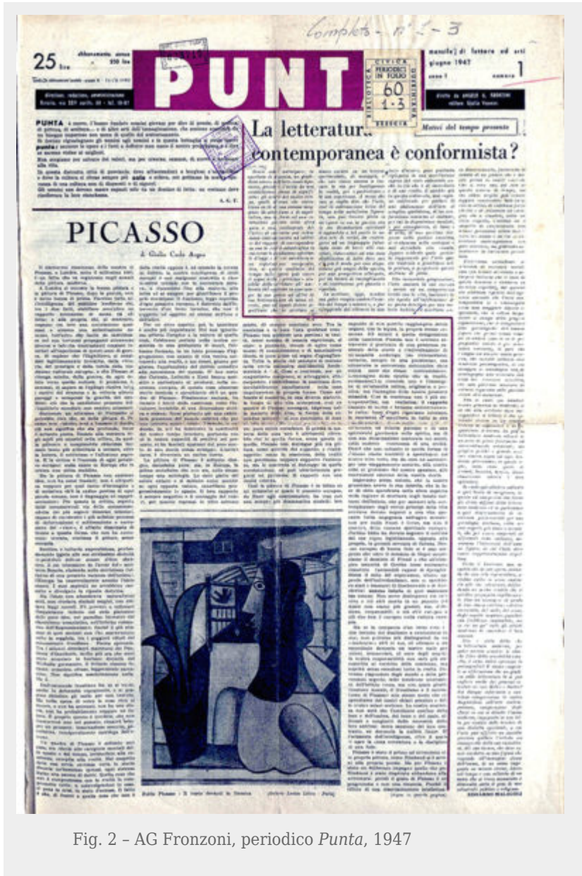
Fig. 2 - AG Fronzoni, periodico Punta , 1947

Ma solo dopo gli anni sessanta entrambi escono da queste committenze tradizionali per confrontarsi attraverso la didattica e il rapporto con gli studenti. I due esperimenti, che in questo saggio prendiamo come casi emblematici, vedono il medium rivista/periodico protagonista applicato alla ricerca didattica portata avanti da entrambi. La rivista U del 1969 e il periodico U di Urbino del 1969, nati entrambi nei luoghi in cui i due grafici praticavano l'insegnamento. L'esperimento didattico della rivista di Fronzoni, scaturito da un esemplare accanimento (studenti Umanitaria-Fronzoni-scuola) rispetto al problema della riqualificazione didattica in un momento critico della scuola Umanitaria, è confrontabile in termini di strategia con lo storicizzato progetto dell'immagine