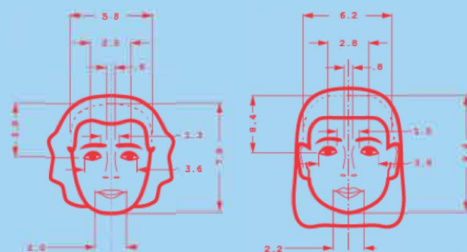
Henry Dreyfuss (02/03/1904), Josephine, 1955