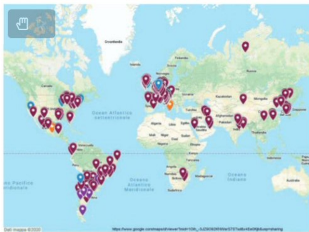
Figura 4 Mapa on line.

El análisis de los datos estadísticos permitió excluir algunas hipótesis formuladas por varios estudiosos: la correlación entre la contaminación del vehículo y las muertes en primer lugar. En segundo lugar, la representación cartográfica puntual relacionada con todos los datos disponibles (número de muertes por municipio) y la edad de los sujetos fallecidos abordaba la siguiente hipótesis: todas las áreas con alta mortalidad por Covid-19 se caracterizan por ser lugares de producción de acero, pero en la provincia de Bérgamo los muertos son casi exclusivamente ancianos.