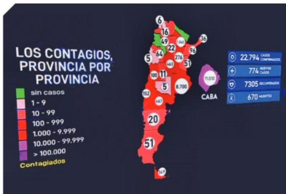
Figura 3 Datos Argentina, junio 2020.

Y si las emisiones del tráfico hubieran desempeñado un papel en la determinación de la mortalidad, los datos habrían demostrado que las muertes se distribuyeron en todos los grupos de edad. Las concentraciones en el aire de PM10, ozono y dióxido de nitrógeno no están vinculadas de manera simple a las fuentes de emisión; sino que están mediadas por una serie de procesos químicos y físicos.