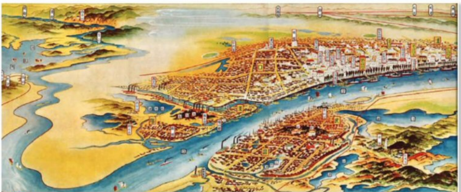
Figura 2 Hankou ahora Wuhan en 1930

Las emisiones del tráfico no han jugado un papel en esta masacre en Italia, pero pueden tenerla en muchos Países que no usan combustibles con bajo contenido de azufre.