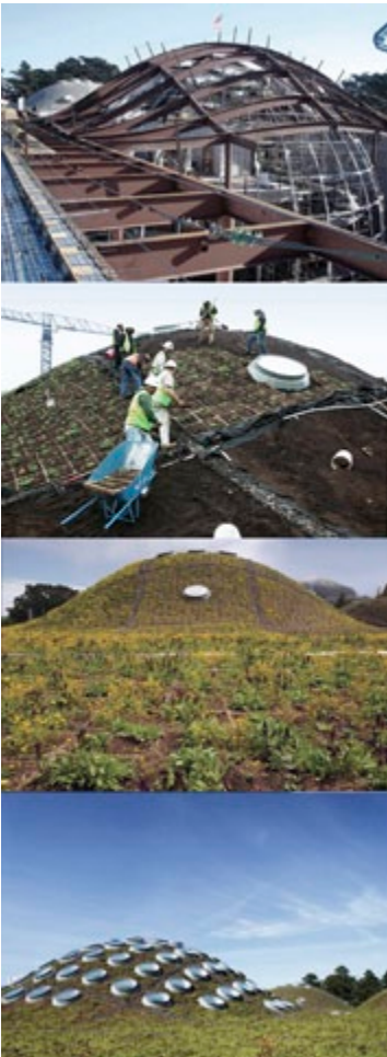
10 | Tema 03/HP, azione 7, tecnologie per il morphing architettura/terreno, landform architecture / Topic 03/HP, action 7, technologies for architecture/soil morphing, landform architecture