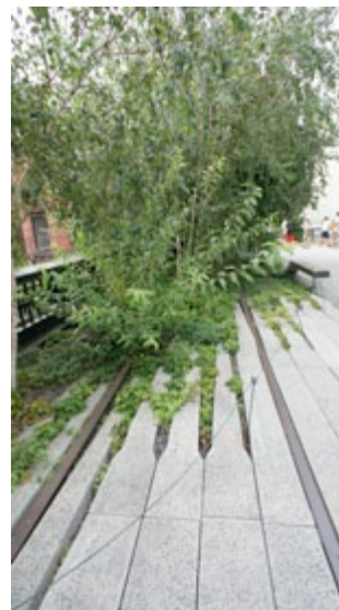
11 | Esempio di applicazione dell'approccio creativo e tecnologicamente avanzato in un contesto peri-urbano infrastrutturale: la High-Line a New Work / Creative and technologically advanced application example in a peri-urban infrastructure: the "High-Line" New Work