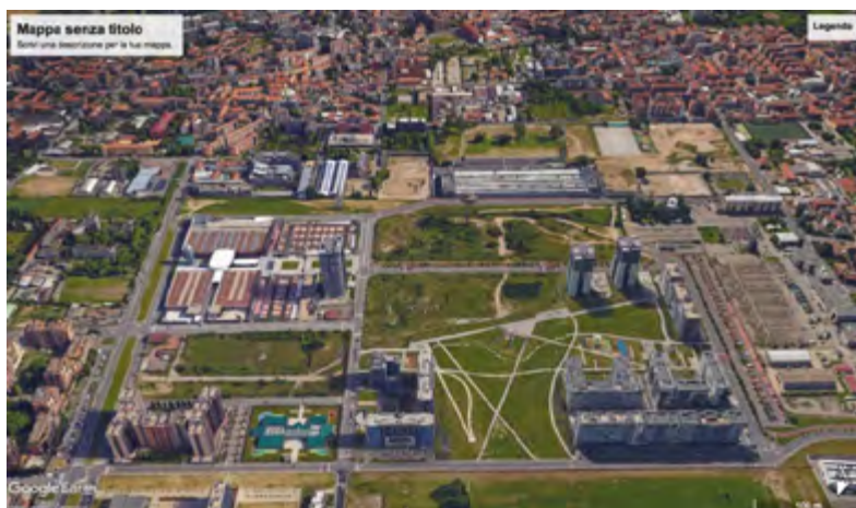
Figura 3 | Quartiere Adriano: vista a volo d'uccello dell'ex comparto Magneti Marelli con il parco ed il masterplan incompiuto

e per il tempo libero (22mila mq): asilo nido (1800 mq.), scuola materna, centro polifunzionale a prevalente carattere sportivo, residenza universitaria e per anziani. Di particolare rilevanza il centro sportivo attrezzato (3700 mq) che avrà, oltre alla piscina, palestre e luoghi dedicati a manifestazioni e spettacoli. Dei complessivi 500mila mq, comprensivi del recupero della Cascina San Giuseppe, circa 306mila erano di competenza di due società: Aedes e Gefim (area Marelli – Adriano). Il quartiere, con l'impulso della bolla immobiliare di quegli anni, parte alla grande ma nel 2008 irrompe la crisi economica globale che rapidamente inizia a mietere le sue vittime locali: gli sviluppatori crollano per difficoltà legate al grosso indebitamento verso vari enti di credito. Vista la contrazione generale delle vendite i cantieri degli altri edifici non ancora avviati vengono congelati, insieme al sogno di un quartiere ideale immerso nella natura.