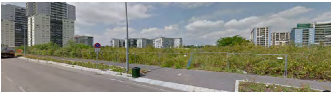
Figura 4 | Quartiere Adriano: visuale degli spazi residuali dalla via Vittorio Gassman. Sullo sfondo la rarefazione delle torri residenziali.

Il tema dell'incompiuto e del "non-finito" che connota l'iter progettuale della trasformazione del quartiere Adriano, permea ed inficia ovviamente la qualità del suo spazio pubblico, in attesa delle strategie di rigenerazione urbana delle Periferie promosse dal Comune. Ma qual'era l'idea iniziale di common ground della proposta iniziale? Il masterplan approvato dello studio CaputoPartnership (2004-2006), basava i suoi elementi essenziali nel rapporto spaziale e funzionale con Via Adriano e con il vasto parco centrale.