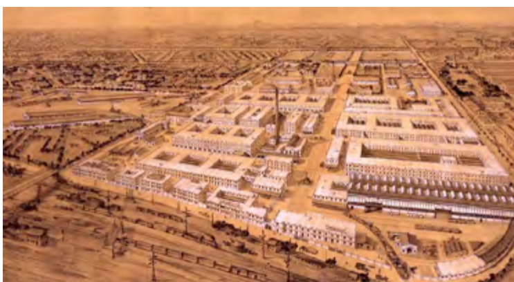
Figura 1 | Bicocca. Veduta a volo d'uccello dello storico insediamento industriale Pirelli

Questo secondo aspetto risulterà determinante nel momento in cui l'innovazione tecnologica, la crisi economica, e una diversa organizzazione delle strategie produttive relegherà sullo sfondo lo scenario scientifico tecnologico a dispetto di una maggiore e pressante richiesta di