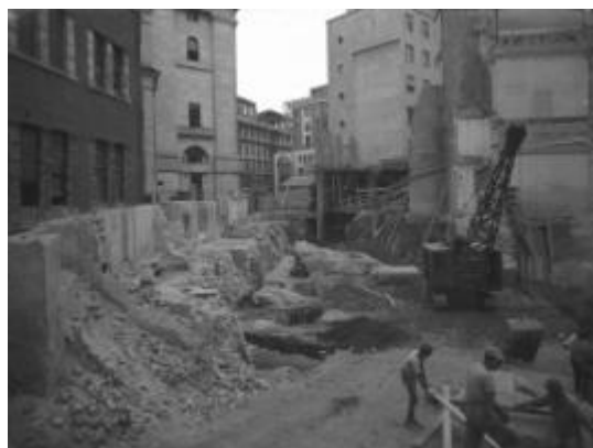
Fig. 1. Gli scavi del teatro presso Palazzo Mezzanotte (ATS).

La tipologia dei materiali è risultata molto eterogenea, così come le informazioni che è stato possibile ricavarne: documenti di corrispondenza di quella che fu la Soprintendenza alle Antichità con i privati o altri organi decisionali e di tutela, atti amministrativi e giuridici, preventivi di spesa, ipotesi di progetto, relazioni storiografiche, diagnostiche e di intervento, fotografie, disegni. La grande massa di informazioni, conservata in faldoni organizzati con criterio di scomposizione geografico, a loro volta suddivisi in cartelle ordinate con successione temporale, è stata selezionata e riordinata all'interno di