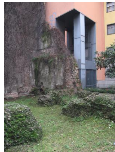
Fig. 3. I resti del circo.

Tra i beni ispezionati durante il progetto «Milano Archeologia per Expo 2015. Verso una valorizzazione del patrimonio archeologico della città di Milano» troviamo siti e resti archeologici appartenenti alla città della Milano Romana conservati sia all'esterno che in ambienti interni di edifici prevalentemente di proprietà privata. Le principali problematiche dei beni conservati all'esterno sono il cattivo stato di conservazione caratterizzato dalla presenza diffusa di vegetazione e da fenomeni quali la disgregazione e conseguente perdita delle malte di allettamento, naturale esito dell'esposizione continua agli agenti atmosferici e della mancata o carente manutenzione. Per esempio ritroviamo fenomeni di degrado legati all'esposizione all'esterno tra i resti del circo conservati in via Vigna 1 e in Via Circo 11.