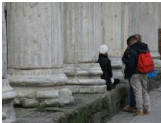
Fig. 5. Le colonne di San Lorenzo.

Se infatti si agisce sulla vulnerabilità, che come si è visto è proprietà intrinseca dei manufatti, occorre valutare la possibilità che si debba inevitabilmente alterarne la consistenza materica. Ciò è spesso necessario al fine di garantire la conservazione, se non addirittura la sopravvivenza, dei manufatti ma ineludibilmente ne altererà l'autenticità materica. Lavorare invece sul fronte della pericolosità significa modificare le condizioni ambientali in cui un bene si trova, agendo su diversi fattori che possono essere di natura microclimatica ma anche di esposizione, ad esempio, come si è visto, all'azione antropica. Ciò potrebbe, ad esempio, comportare l'introduzione di soluzioni allestitive che limitino la fruibilità del bene, impedendo l'accesso a certe aree o compartimentando lo spazio con vetrate o altre soluzioni tecniche.