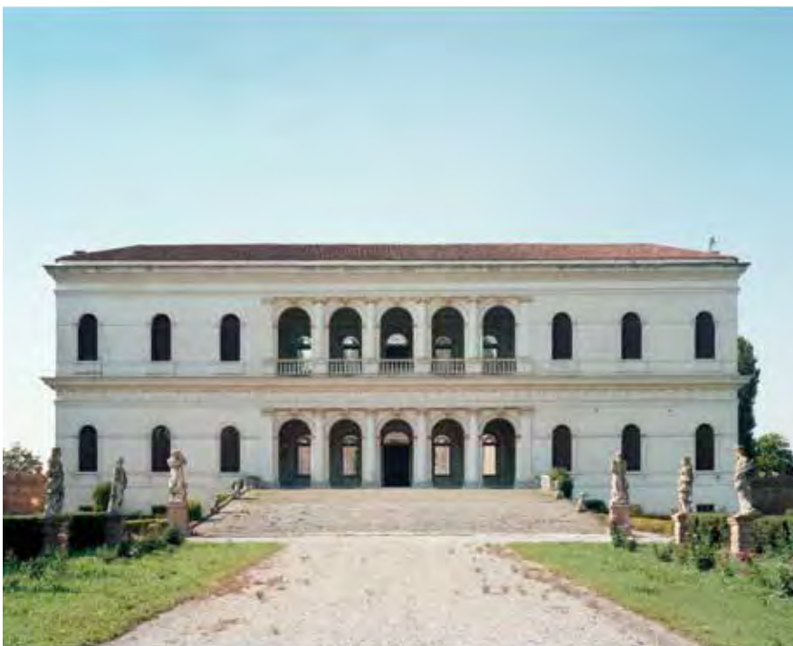
Fachada de Villa Garzoni, Candiana, Italia, 1540 (Arquitecto: Jacopo Sansovino). Façade of the Villa Garzoni, Candiana, Italy, 1540 (Architect: Jacopo Sansovino).