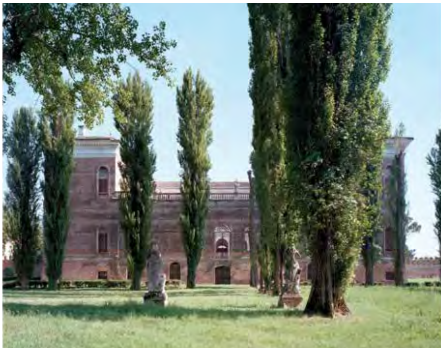
Villa Garzoni, Candiana, Italia, 1540 (Arquitecto: Jacopo Sansovino). Villa Garzoni, Candiana, Italy, 1540 (Architect: Jacopo Sansovino).