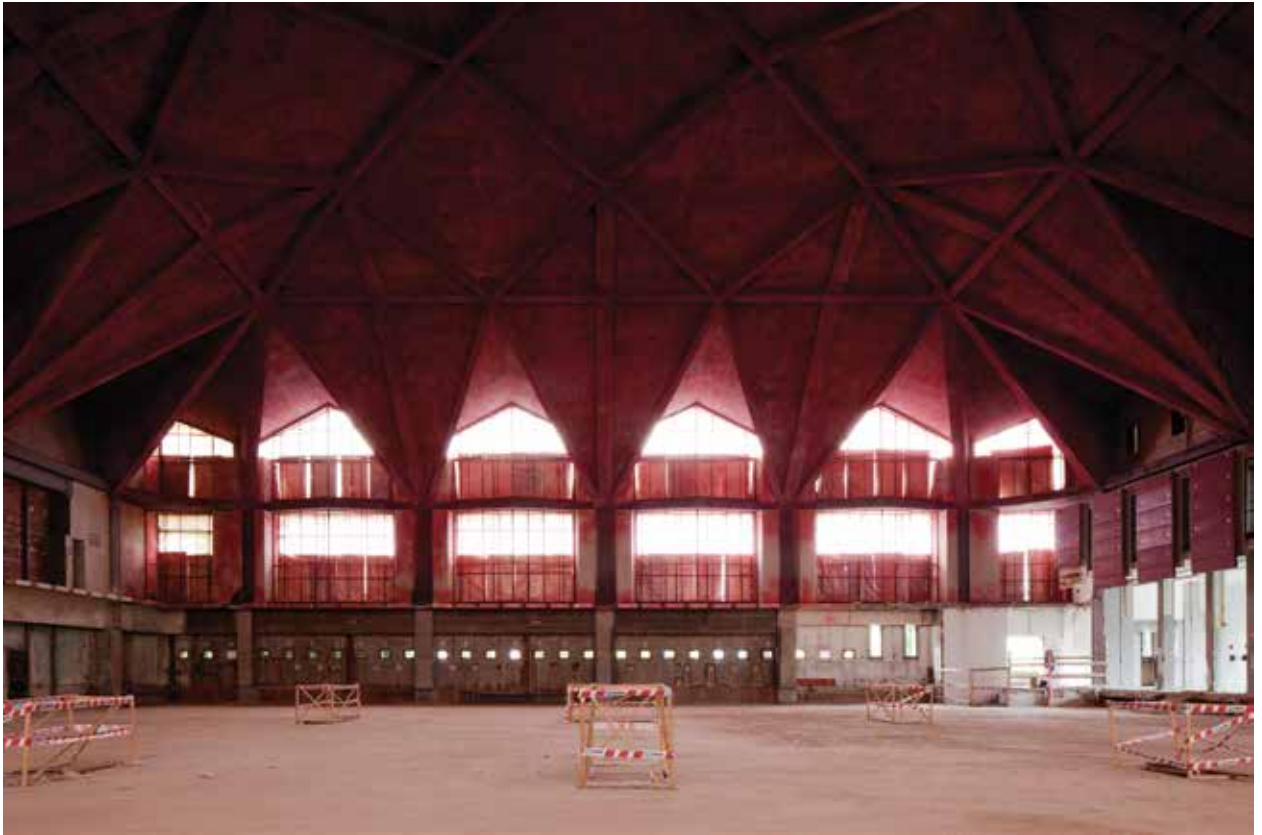
Antiguo edificio de la bolsa de valores, Turín, Italia, 1956 (Arquitectos: Roberto Gabetti, Aimaro Oreglia d'Isola y Giorgio Raineri). Former Stock Exchange building, Torino, Italy, 1965 (Architects: Roberto Gabetti, Aimaro Oreglia d'Isola and Giorgio Raineri).