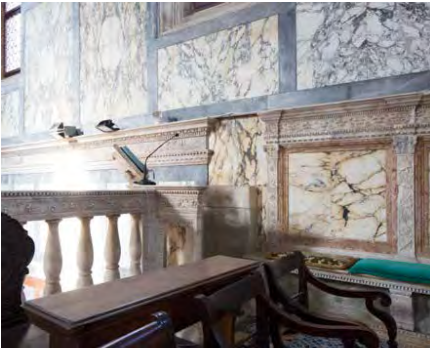
Interior de la iglesia de Santa María de los Milagros, Venecia, Italia, 1489 (Arquitecto: Pietro Lombardo). Fotografía: Stefano Graziani, 2016. Fuente: San Rocco 13. Imagen cortesía de San Rocco. Interior of the church of Saint Mary of the Miracles, Venice, Italy, 1489 (Architect: Pietro Lombardo). Photograph: Stefano Graziani, 2016. Source: San Rocco 13. Image courtesy of San Rocco.