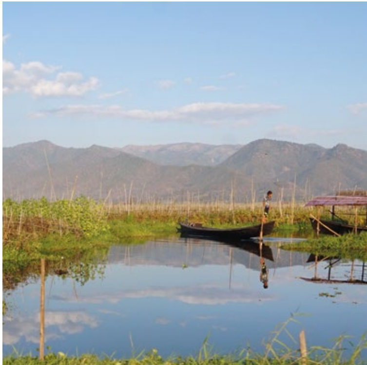
→ Lago Inle, Myanmar 2017, dettaglio