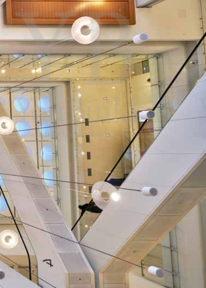
Vista interna del sistema di ventilazione e illuminazione naturale. Sotto, lo spazio centrale del grande atrio

Emilia Corradi, Architetto PhD e ricercatore in Composizione Architettonica e Urbana presso il Dipartimento di Architettura e Studi Urbani, Politecnico di Milano. Si occupa di progettazione architettonica in particolare sui temi del riciclo dei manufatti infrastrutturali alle diverse scale soprattutto nei territori minori. Ha partecipato a numerosi concorsi e bandi nazionali e internazionali ottenendo diversi riconoscimenti. I suoi progetti e i suoi scritti sono pubblicati su cataloghi e riviste nazionali ed internazionali.