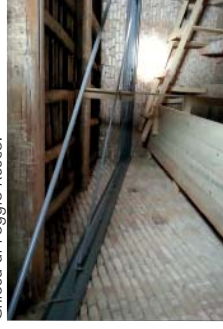
Collegamento della facciata alla navata