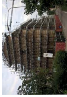
Chiesa di Poggio Rusco.

Un secondo tipo di intervento è stato la posa di una cappa armata a base di calce idraulica naturale mescolata ad inerti leggeri. Dopo aver svuotato il rinfiacco e rimosso la caldana storica (se presente) in gesso, si sono scarnificate