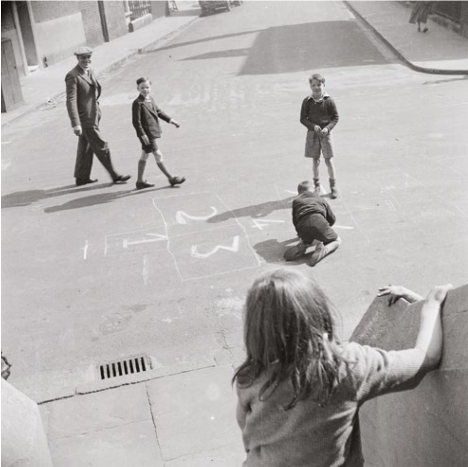
Nigel Henderson, Il diritto alla città , Londra 1949-1956 ca.