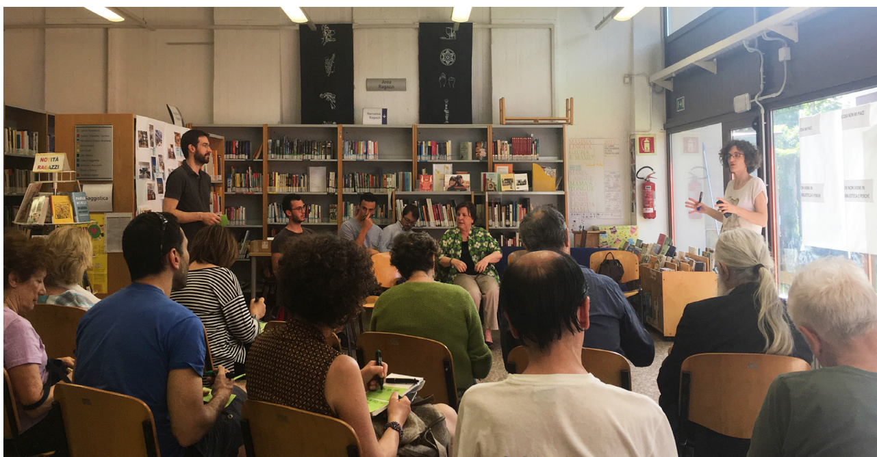
Uno dei workshop con stakeholder locali del quartiere Lorenteggio Giambellino, tenuto da ABCittà

con le realtà locali è emersa l'esigenza che la nuova biblioteca Lorenteggio debba essere il punto di riferimento della comunità locale, luogo di inclusione e coesione sociale, ecosostenibile, ben radicata nel quartiere e integrata con le realtà locali, avviando nuove sperimentazioni (quali le biblioteche di condominio, che potrebbero essere realizzate nelle portinerie dismesse nel quartiere), consolidando sinergie tra tutte le strutture e sedi di realtà locali già presenti nel quartiere (il Mercato Comunale, le associazioni locali, le scuole, gli oratori, i centri di aggregazione giovanile ecc.). Un altro importante tema emerso è quello sfruttare la potenzialità dell'area bambini come attrattore di nuovi utenti e mezzo per facilitare l'integrazione linguistica e culturale delle famiglie straniere, in sinergia con i servizi scolastici, con i mediatori culturali e con le altre realtà locali. Anche da parte delle realtà locali è emersa la richiesta di spazi polivalenti, dove poter organizzare molteplici attività ed eventi, spettacoli, proiezioni, attività teatrali; spazi per la formazione e per attività ludico-didattiche; una sala studio, con spazi adatti anche allo studio di gruppo; spazi per ascoltare musica, evitando di sovrapporsi con le funzioni presenti in altre aree del quartiere. Significativo è anche un ultimo aspetto, emerso dalla consultazione dei "non-utenti" della biblioteca, ita-