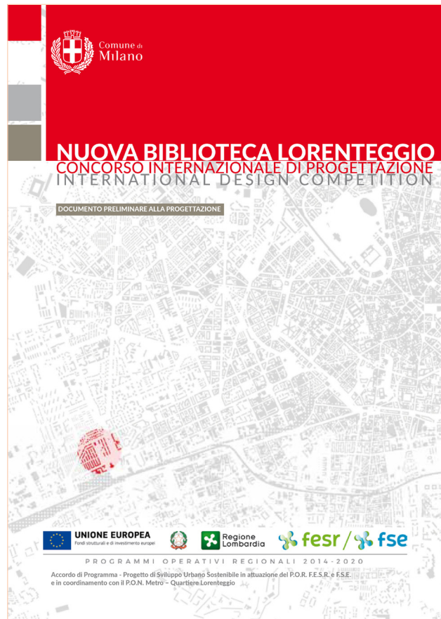
Documento Preliminare alla Progettazione del concorso internazionale per la nuova Biblioteca Lorenteggio

La biblioteca, da sempre luogo di conservazione, diffusione e trasferimento della conoscenza contro il “cultural divide”, è oggi anche laboratorio multimediale di informazione, porta di accesso e strumento di orientamento nell'universo delle nuove tecnologie, ausilio contro il “digital divide”. Già dieci anni or sono, questi aspetti erano ben evidenziati dalle Linee Guida IFLA per la progettazione di edifici bibliotecari , che sottolineavano un sostanziale spostamento del focus della biblioteca: “from collections to communication, and from storage to access”. L'accento passa dunque dalle modalità di organizzazione delle collezioni alle modalità di mediazione e comunicazione; dal possesso dei documenti all'accesso (anche remoto) ai documenti stessi; dalla messa a disposizione di materiali documentari (adeguatamente mediati dall'attività di