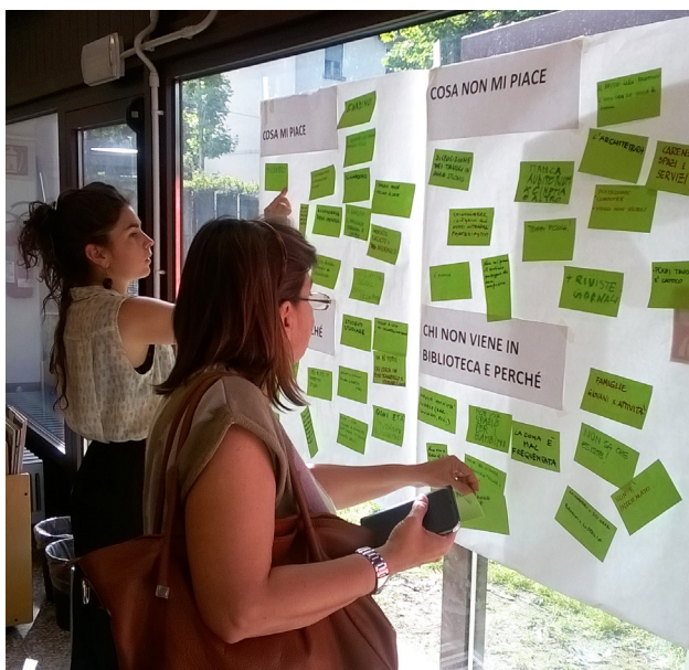
Uno dei workshop con gli utenti della Biblioteca Lorenteggio, tenuto da ABCittà

guida. Ricordiamo, in particolare la richiesta di avere una buona “visibilità” e riconoscibilità del nuovo edificio, valorizzando il rapporto e la continuità tra spazi interni ed esterni; avere un atrio ampio, accogliente e informale; puntare sull’automazione dei servizi di prestito, vista come un’opportunità per i bibliotecari di sgravarsi dal lavoro ripetitivo, per potersi dedicare meglio all’assistenza agli utenti e al servizio di reference; avere un’area riviste e giornali che consenta di conversare e socializzare; realizzare un’area per i più piccoli articolata in spazi tali da consentire comportamenti diversi: alcuni più raccolti e silenziosi, altri più aperti e rumorosi; attrezzare spazi studio con tavoli dotati di lampade, e salette riservate per lo studio di gruppo; avere spazi per spettacoli e proiezioni, per bambini, ragazzi e adolescenti; avere una segnaletica efficace e percorsi che consentano agli utenti di orientarsi facilmente; allestire spazi e arredi in grado valorizzare il patrimonio librario esposto; avere spazi flessibili, in grado di accogliere attività diverse tra loro; poter godere di un giardino di pertinenza; avere spazi dove fare attività laboratoriali, ludico-didattiche, musicali ecc. per il tempo libero e per la formazione. Nella “vision” emersa nel workshop con gli utenti è avvertita come fondamentale la componente “sociale” della biblioteca, il suo essere luogo di inclusione e coesione sociale, possibile fulcro del processo di cam-