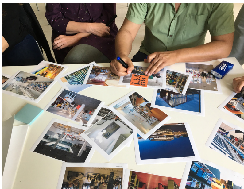
Workshop con i bibliotecari tenuto da ABCittà

È emersa chiaramente la funzione di presidio sociale svolta dalla biblioteca in un contesto sociale estremamente difficile, nonostante la scarsa dimensione dell'edificio, del tutto inadeguato a ospitare le funzioni che dovrebbe svolgere. Benché vi sia un forte radicamento nel territorio e con le associazioni locali, la biblioteca risulta non essere conosciuta come potrebbe, gli utenti sono pochi rispetto all'utenza po-