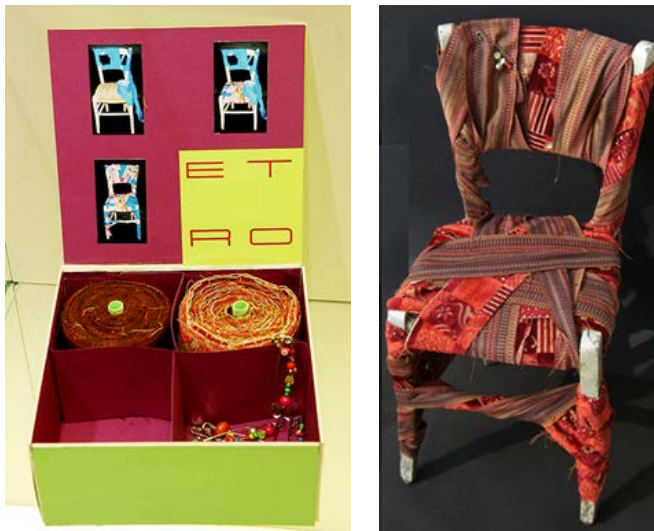
Figura 2 – Kit Kittavolgi e proposta de cadeira revestida com os resíduos

Luci Rosse (Figura 3) relembra, por um lado, o mundo das luminárias penduradas na parte externa dos restaurantes chineses, por outro, remetia a um significado mais ousado e audacioso vinculado ao imaginário do mundo dos adultos. O projeto consistia na criação de alguns lustres realizados em tecido e pensados para representar uma variedade de silhuetas de saias femininas. Para que o produto continuasse a lidar com o elemento surpresa, foi projetado de modo que, olhando sob o lustre, o espectador não via a lâmpada mas sim, uma outra peça do vestuário.