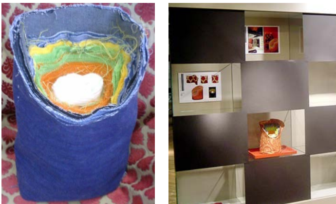
Figura 1 – Poltrona Regina

O projeto Regina utilizou resíduos de materiais têxteis: previa-se que todos os tecidos fossem agrupados sobrepostos, depois enrolados e em seguida cortados transversalmente para obter um assento. A Figura 1 mostra o protótipo da poltrona Regina e o produto em exposição na Mostra ETRO Le Trame Avvolgenti , realizada no showroom da empresa, por ocasião do Salone del Mobile 2006 , em Milão.