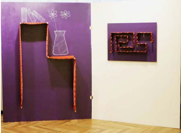
Figura 4 – Protótipos e modelos do projeto Alosnem