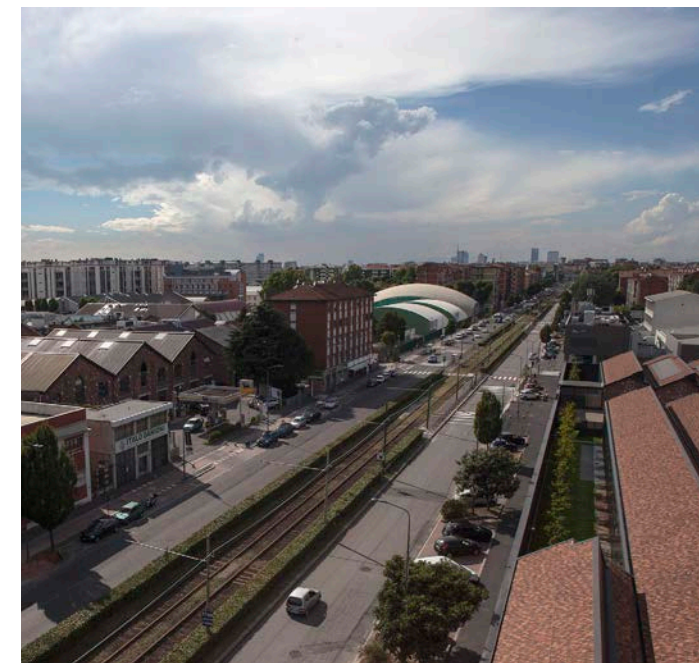
VISTA DALL'ALTO DELL'AREA EX-CAPRONI SULL'ASSE DI VIA MECENATE, IN BASSO A DESTRA UNO SCORCIO SUL NUOVO GUCCI HEADQUARTERS

La Tangenziale est e il fiume Lambro hanno così rappresentato gli elementi catalizzatori di uno sviluppo spontaneo; episodi spontanei sono stati anche gli interventi di riuso all'interno degli antichi impianti delle fabbriche del quadrante est della città. Un metabolismo urbano della città ordinaria, avvenuto principalmente attraverso interventi edilizi – la cui notorietà è in larga misura attribuibile al fenomeno abitativo dei loft – che ha interessato la prima periferia urbana (Caproni, Ventura, Ortica-Rubattino), perlopiù a ridosso della cintura ferroviaria, in particolare nelle zone industriali confermate dal Piano Regolatore Generale del 1976. Nella maggior parte dei casi, ha interessato aree di medie o piccole dimensioni – da 1 a 3 ettari –, risultato del processo di deindustrializzazione manifatturiera che la città ha conosciuto fin