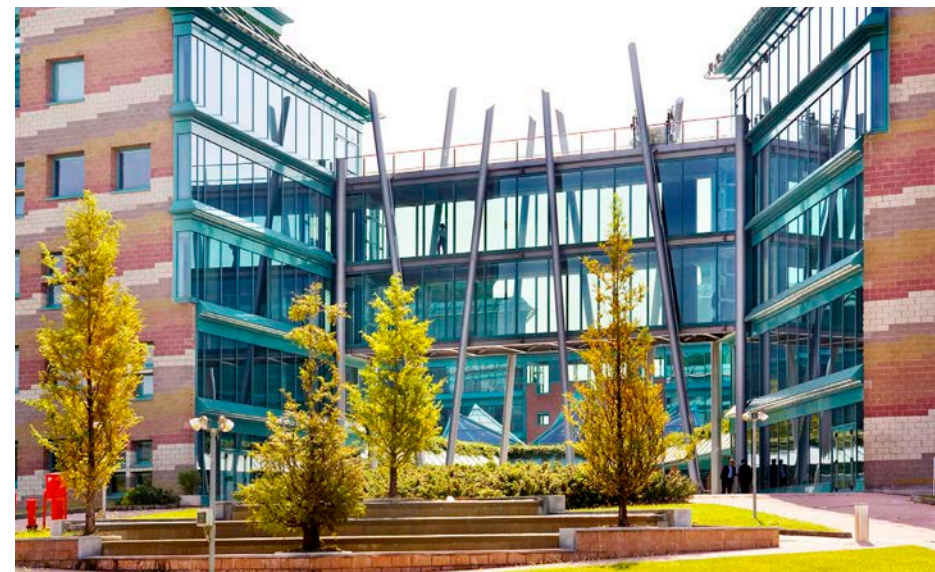
VISTA DI UNA PARTE DELL'IBM HEADQUARTERS DALLA CORTE INTERNA

5. Petrangeli M. (a cura di), Architettura come paesaggio. Gabetti e Isola. Isolarchitetti . Allemandi, Torino, 2005