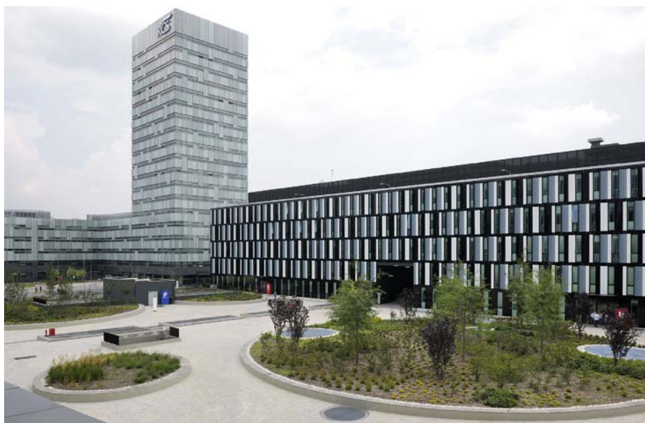
VISTA DELL'HEADQUARTERS

L'Headquarters ( lotto C realizzato per primo), ospita le testate dei periodici RCS e più di 1.000 addetti; lo sviluppo in pianta dell'edificio disegna una corte