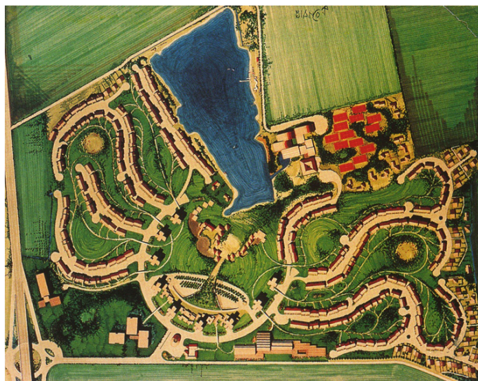
PLANIMETRIA GENERALE (IMMAGINE GENTILMENTE CONCESSA DA FONDAZIONE VICO MAGISTRETTI)

autonomi di edilizia economica-popolare, che rafforzano la presenza storica di edilizia pubblica in questa parte di città 2 e che costellano il margine orientale della città moderna: Feltre (Ina Casa, 1957 – 1963), Forlanini (IACP, 1960 - 1964); Ponte Lambro (IACP, 1973), Taliedo-viale Ungheria (IACP, 1958 – 1960); ma anche alcuni grandi quartieri popolari nei comuni di prima cintura (fra gli altri, il Satellite a Pioltello, 1962 – 1964, 8.000 residenti). Negli stessi anni e a seguire, nel periodo del grande boom edilizio, si realizzano i quartieri autonomi – gated community nei comuni di prima cintura: a Segrate Milano 2 (1970 – 1979, 6.000 residenti), realizzato dall'Edilnord Progetti di Silvio Berlusconi dopo quello di Brugherio (1963 - 1966, 4.000 residenti); Milano San Felice, su volere dell'ing. Giorgio Pedroni e progetto di Luigi Caccia Dominioni e Vico Magistretti (1965 – 1969, 3.000 residenti); il Villaggio Ambrosiano, su iniziativa del Cardinale Schuster (1957 – 1963, 4.000 residenti). Ma anche Metanopoli, company town e quartiere residenziale dell'ENI a San Donato (1952 – 1958, 6.000 abitanti), voluti fortemente da Enrico Mattei e progettati nel loro impianto da Mario Bacciocchi.