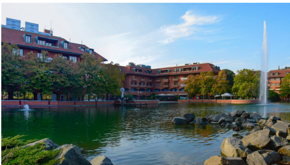
VISTA DEL LAGHETTO CENTRALE

fuori dalla città: due caratteristiche allora inedite e senza precedenti. Berlusconi optò all'inizio per un effetto di chiusura e protezione: "[...] una volta entrati a Milano2, non si percepisce il mondo esterno" 3 ; un quartiere con tutti i confort, sicuro e tranquillo 3 ; un'isola felice, ma soprattutto un'isola 4 ; promuovendo contemporaneamente il sogno di un mondo separato dal caos urbano. In seguito alle prime poco fortunate campagne di vendita 5 , il progetto venne arricchito tipologicamente e funzionalmente 6 , integrandolo con edifici a torre, un centro