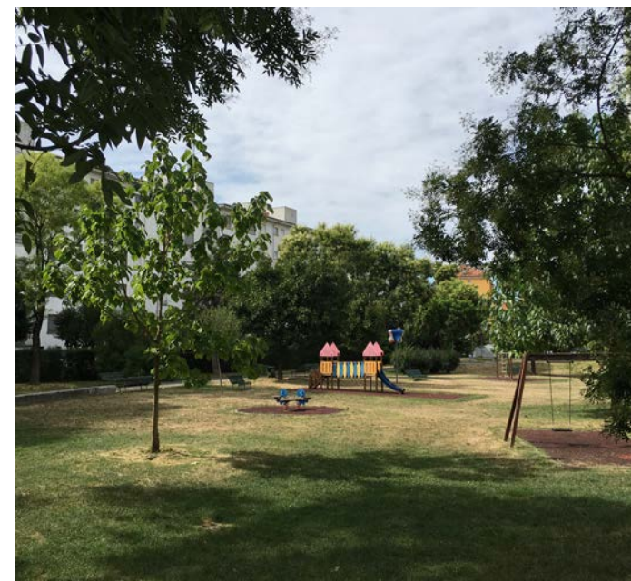
VISTA DEL QUARTIERE PONTE LAMBRO NEI SUOI SPAZI VERDI

L'intercomunalità milanese ha una storia lunga, che affonda le sue radici nelle vicende eroiche del Piano Intercomunale Milanese (PIM), a partire dalla definizione di due iniziali schemi di piano, poi sintetizzati operativamente nella versione approvata (1967), di potente forza suggestiva, quando ancora si confidava ottimisticamente nella razionalità spaziale dell'urbanistica: lo schema a turbina del 1963 (De Carlo, Tintori, Tutino, tecnici nominati dai Sindaci di sinistra, socialisti e comunisti), un modello policentrico che proponeva la rottura del sistema radiocentrico a favore di un sistema articolato equipotenziale, in cui emergono il Parco Sud e la cintura verde, il passante e l'annullamento della centralità a favore di un sistema multi-nodale; lo schema di sviluppo lineare del 1965 (Bacigalugo, Corna Pellegrini, Mazzocchi, nominati dai sindaci democristiani, ma della sinistra cattolica), comunemente definito "il biscione": un piano d'infrastrutture alla scala metropolitana-regionale, che, assecondando la crescita spontanea dell'area milanese e della "conurbazione pedemontana", prevedeva il potenziamento del sistema infrastrutturale lungo le principali direttrici est-ovest,