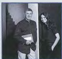
EFA Emilio Faroldi Associati

Lo studio Emilio Faroldi Associati - oggi EFA_Esperienze Forme Architettura - affronta i temi della città, i suoi territori molteplici, le architetture che li compongono, le tecnologie atte al loro divenire costruzione, esplorati nella loro dualità di contenuto funzionale-prestazionale e di sintesi morfologico-compositiva. Paesaggio, sviluppo sostenibile e innovazione tecnologica sono gli elementi di confronto del metodo progettuale, applicato alla complessità di luoghi, spazi e fenomeni contemporanei.