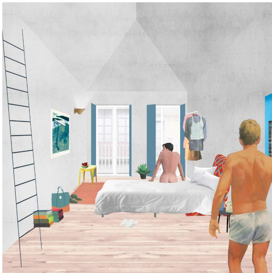
Fala Atelier, Building with Three Apartments , collage digitale, Oporto, Portogallo, 2015