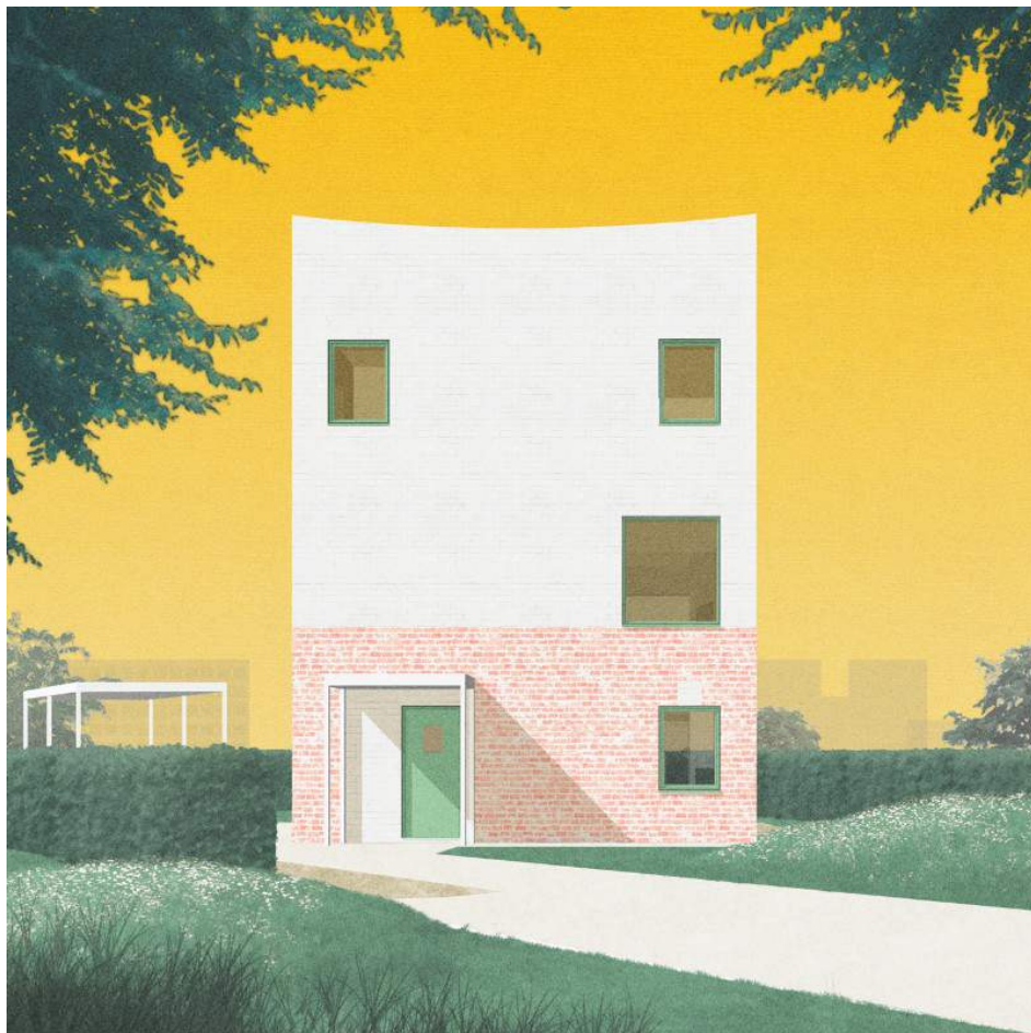
Monadnock, Atlas House, 2013.