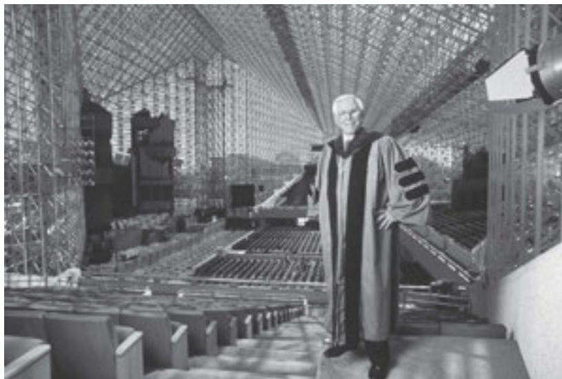
The Rev. Robert H. Schuller, founder of the Hour of Power television show, in his Crystal Cathedral, 1997.

Indeed, the Crystal Cathedral is not just a spectacular building, but a device that recognizes with incredible subtlety the ideological presuppositions embedded into the landscape where it happens to be located and succeeds in turning these features into an amazing spatial mechanism. The Crystal Cathedral is a built commentary on American landscape, a spatial essay on the peculiar condition of American Christianity. The Crystal Cathedral is not only placed in its own parking lot with perfect indifference, it is also designed precisely as a building without foundations, a building that would not oppose being moved elsewhere, should this be needed. Inside, the colossal church is filled with an incredibly soft light that devolves from the slightly opalescent glass envelope. In an interview in the American Architecture Now series that Barbaralee Diamonstein-Spielvogel used to run in the 1980s, Philip Johnson spoke at length of the “underwater” quality of the light inside the Crystal Cathedral. 2 The surprising lightness corresponds to a very simple, and at the same time very subtle, organization of the plan. The main access is on the short axes, a square clearance is in the middle, right in front of the altar, defined on its three borders by tribunes that cover the three corners of the four-pointed star that are not occupied by the altar.