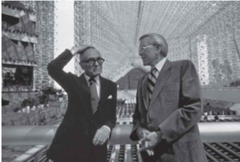
El reverendo Robert H. Schuller (derecha) con el arquitecto Philip Johnson (izquierda) en la Catedral de Cristal, 1980.