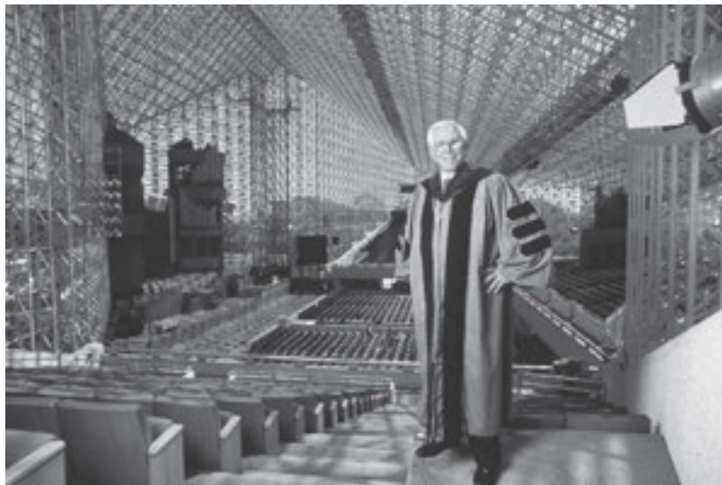
El reverendo Robert H. Schuller, fundador del programa televisivo Hour of Power , en su Catedral de Cristal, 1997.

de arquitectura, y nada de la de Johnson. El origen de estas interpretaciones de su arquitectura se retrotrae al propio Johnson; sin duda, gran parte de su producción puede explicarse en términos de modas culturales, y deja de lado cualquier interés más profundo por los lugares o los espacios. De hecho, si el núcleo de la búsqueda artística de Johnson es tan claramente el espíritu de los tiempos , es comprensible que resulte complicado debatirla en términos de arquitectura, una práctica que, a fin de cuentas, solo trata del espacio . Así, probablemente podría desatenderse del todo la figura de Johnson como arquitecto (y relegarlo al infierno de los críticos de arquitectura), de no ser por el único edificio fascinante que proyectó: la Catedral de Cristal.