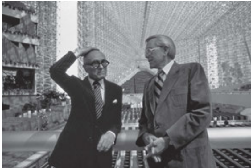
The Rev. Robert H. Schuller (right) with the architect Philip Johnson (left) in the Crystal Cathedral, 1980.

founded the Garden Grove Community Church. Initially the services took place at the Orange Drive-in Theater. Schuller invited worshippers under the slogan: “Come as you are in the family car.” It was an immediate success.