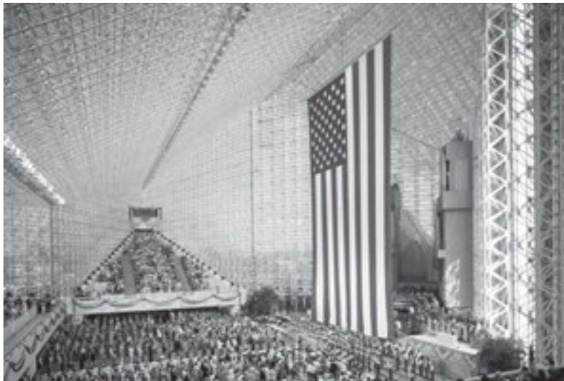
La Catedral de Cristal, condado de Orange (California), Estados Unidos.

gramas American Architecture Now que Barbaralee Diamondstein-Spielvogel dirigió en la década de 1980, Philip Johnson hablaba largo y tendido de la cualidad “submarina” de la luz del interior de la Catedral de Cristal. 2 La sorprendente luminosidad obedece a una planta de organización muy sencilla, y al mismo tiempo muy sutil. El acceso principal está situado en el eje corto , y en el centro hay un espacio libre cuadrado, justo frente al altar, definido en sus tres límites por tribunas que cubren las tres esquinas de la estrella de cuatro puntas que no están ocupadas por el altar.