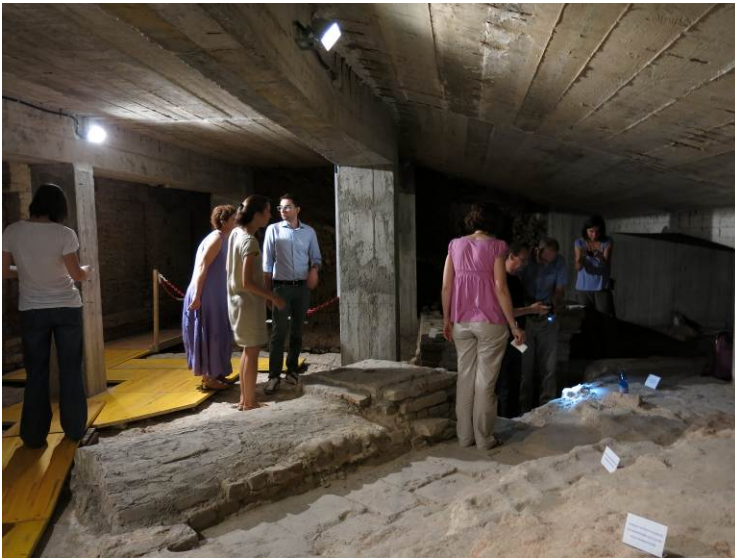
Fig. 3. Il gruppo di lavoro, Mausoleo di S. Vittore al Corpo.

su supporti informatici già in uso presso la Soprintendenza per i Beni Archeologici. Gli strumenti di