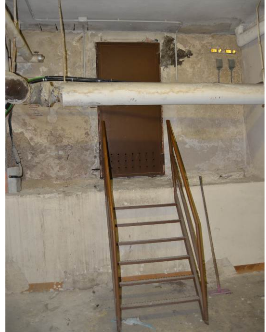
Figg. 7 e 8. Esempificazione di rischio per visitatori e operatori, Strada di via dei Piatti 10 – Palazzo Archinto.

La valutazione delle condizioni di rischio 22 , necessaria per la stima dell'urgenza dell'intervento, per Milano archeologia, è stata assolta dalle visite ispettive e dai report che, in modo propedeutico, indicheranno le attività da svolgersi per la conservazione dei beni.