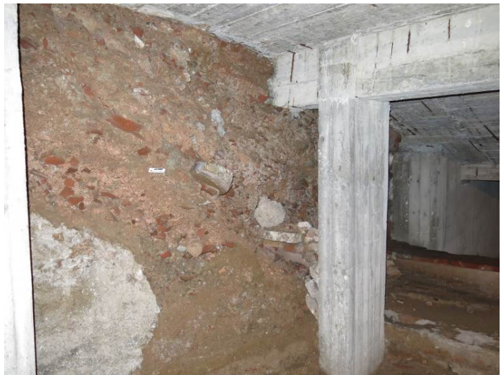
Fig. 5. Esempificazione di rischio per opere edili, documento d'archivio, Mura Massimiane di via Montenapoleone 27 (ATS).

Il "vocabolario" delle tipologie di danno della Carta del Rischio individua, per i manufatti archeologici, sei grandi categorie, tra queste vi sono, i danni strutturali, le disgregazioni materiali, l'umidità, gli attacchi biologici, l'alterazione degli strati superficiali, e parti mancanti. Tutti questi "danni" sono problematiche riscontrabili, in senso lato, anche nel restauro architettonico, ma, vocazionalmente, sono fenomeni specifici per i manufatti che si presentano allo stato di rudere.