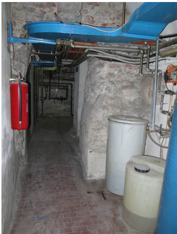
Fig. 6. Esempificazione di rischio per opere edili, Mura Massimianee di via Montenapoleone 27.

Oltre alle disgregazioni del materiale - dovute al fatto che i ruderi archeologici spesso sono esposti agli agenti atmosferici in carenza di manutenzione e in condizioni ambientali che mutano stagionalmente 14 - il problema dell'umidità è una questione cogente. Ristagno d'acqua, infiltrazioni, risalite capillari, acqua di percolazione e/o di condensa - con le conseguenti efflorescenze di sali - sono tutti effetti che possiamo leggere sui manufatti archeologici, sia che siano conservati all'esterno, che all'interno. I piani di calpestio dei ruderi in ambito urbano (sia in ambiente esterno, che confinato in luoghi interni agli edifici) si collocano, infatti, molto al di sotto della quota stradale dell'odierno stato di fatto. Una cattiva gestione delle acque nelle aree archeologiche, unitamente alla mancanza di manutenzione, può innescare effetti a catena molto seri.