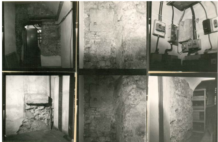
Fig. 4. Esempificazione di rischio ambientale, Mausoleo di S. Vittore al Corpo.

Il dibattito teorico sul restauro archeologico, iniziato alla fine dell'Ottocento, è da tempo pervenuto ad una definizione critica avanzata. Si è abbandonata ormai, almeno dalla cultura italiana, la via delle ricostruzioni/completamenti arbitrari e delle operazioni di de-restauro (ripensamenti metodologici, constatazione di errori storiografici nel rimontaggio dei pezzi per anastilosi