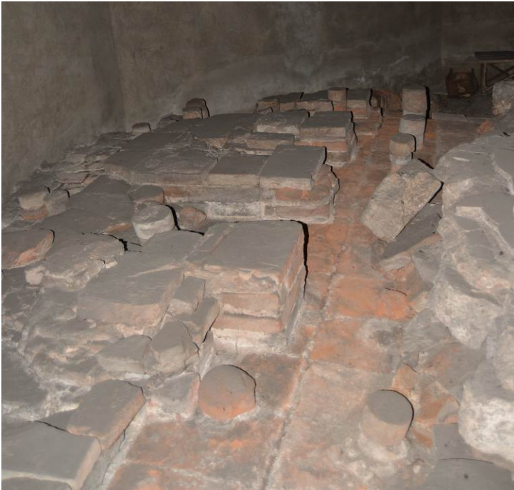
Fig. 1. Particolare delle Terme Erculee in Corso Europa.

L'anamnesi condotta dovrebbe condurre - con consapevolezza - ad un corretto progetto di conservazione, che da un lato vede un impegno volto all'eventuale consolidamento, dall'altra alla cura