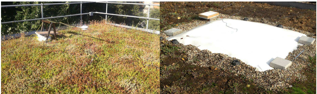
Figura 2. Copertura a verde in sedum su lapillo vulcanico, con l'albedometro posizionato sopra il campo (a sinistra); e membrana impermeabilizzante (albedo 0.77) con sonde di temperatura, sopra il terreno o sopra 6 cm di polistirene espanso estruso (a destra).

medesima membrana bianca è stata posizionata anche sopra 6 cm di polistirene espanso estruso, sempre equipaggiata con una sonda di temperatura superficiale. Per quanto concerne il tetto verde, la temperatura è misurata 2 cm al di sotto della vegetazione con una sonda a penetrazione, mentre l'albedo è misurata con un CMA 11 Kipp & Zonen.