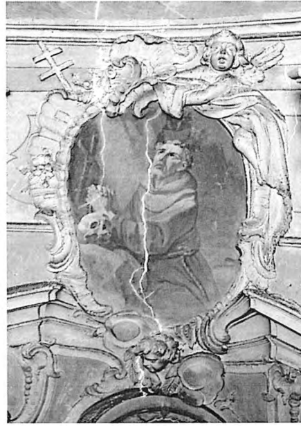
Figura 2 e 3 . Patologie di degrado e dissesti presenti nella chiesa parrocchiale di Castel San Pietro