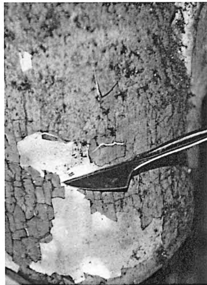
Figura 4 e 5. La chiesa e l'apparato decorativo sono stati interessati da diverse campagne di restauro