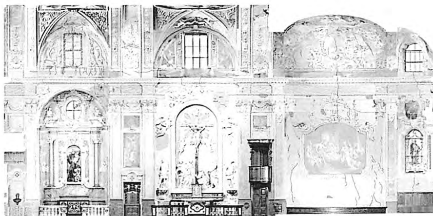
Figura 1. Chiesa di S. Eusebio, Castel San Pietro (Svizzera). Quadro fessurativo prospetto settentrionale

Entrando in chiesa, volgendo lo sguardo al presbiterio, si nota immediatamente la presenza di un'importante quadro fessurativo reso ancora più evidente da un intervento di risarcitura. Prima di addentrarsi nelle specifiche relative la conservazione dell'apparato decorativo risultava fondamentale verificare l'assenza (o la presenza) di problematiche di natura statica. Già nell'aprile 1977 era stata effettuata una perizia sulla chiesa per conto della Saceba (Buzzi, G. 2012), ditta produttrice di cemento che estraeva il calcare e le marne