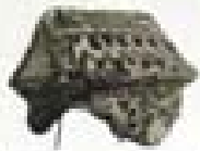
1997 The Perforated Dome Singapore