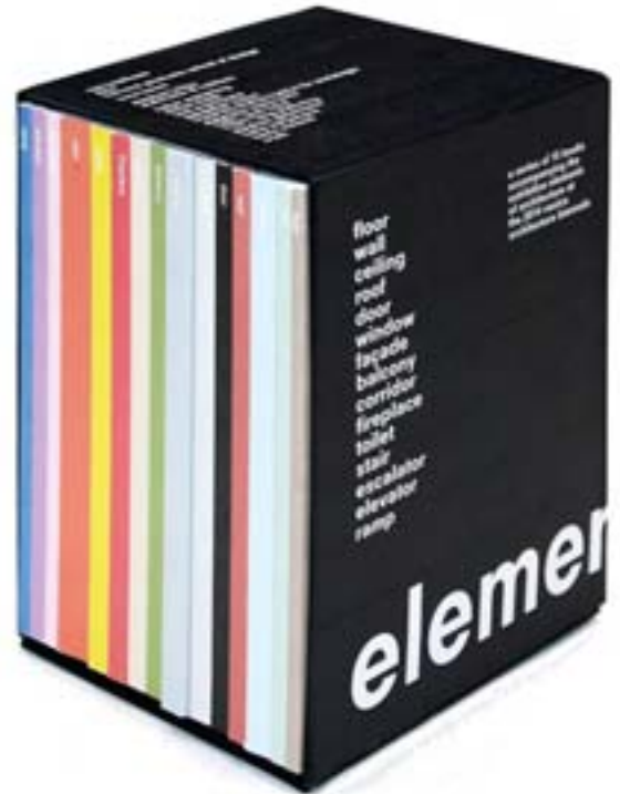
Fundamentals, il catalogo edito da Marsilio.