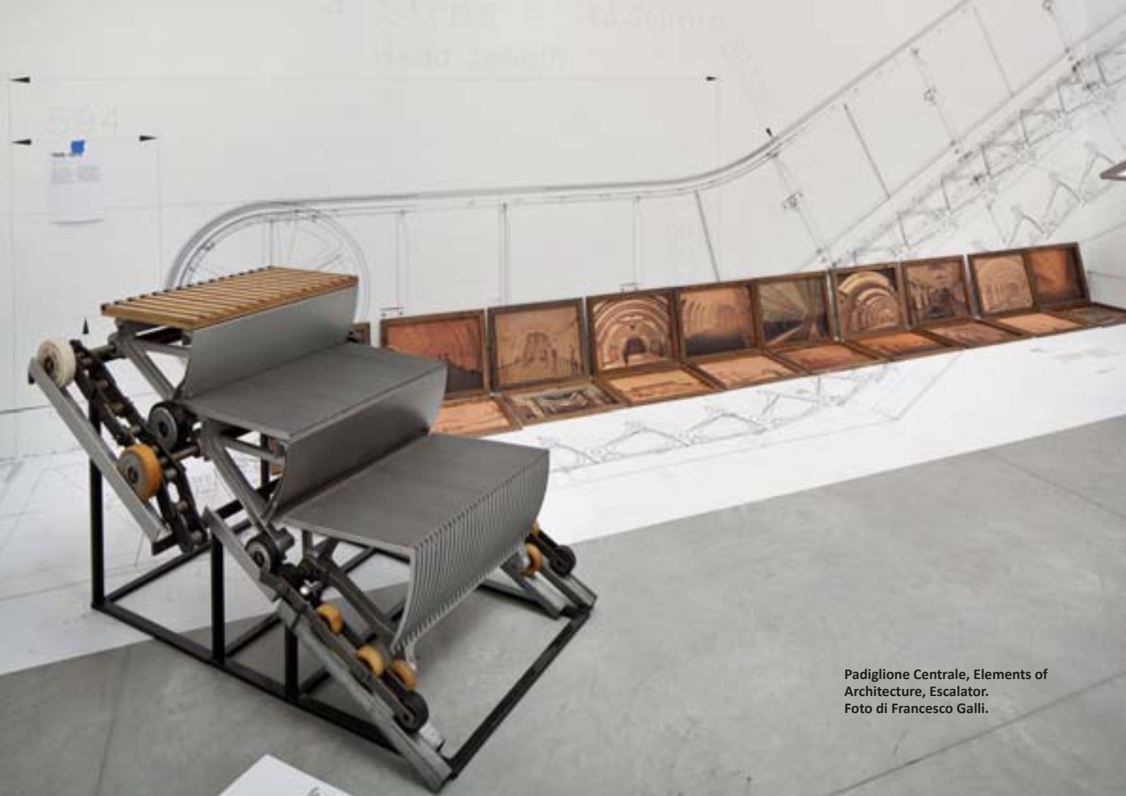
Padiglione Centrale, Elements of Architecture, Escalator.