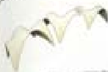
2000 The Curved Roof Singapore