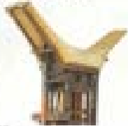
1997 The Curved Roof Singapore