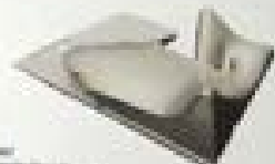
2000 The Curved Roof Singapore