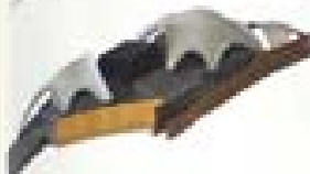
2000 The Curved Roof Singapore