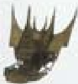
1997 The Curved Roof Singapore