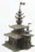
1997 The Pagoda Singapore