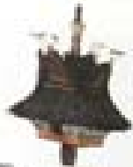
1997 The Curved Roof Singapore