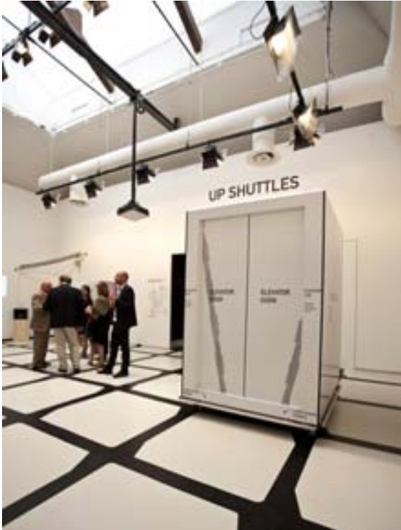
Padiglione Centrale, Elements of Architecture, Elevator.

l'irriducibilità di una mostra che rifiuta di porsi come un'opera d'autore, secondo la tradizione della Biennale, e lavora per costruire l'archivio o il magazzino, l'accumulo più o meno casuale, la deriva, assomigliando molto di più, rispetto alle edizioni precedenti, alle provocatorie e destabilizzanti biennali d'arte.