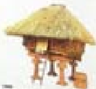
1997 The Thatched Roof Singapore