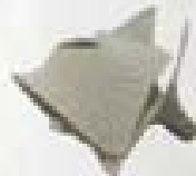
2000 The Curved Roof Singapore