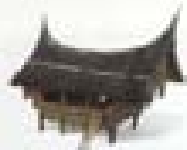
1997 The Curved Roof Singapore