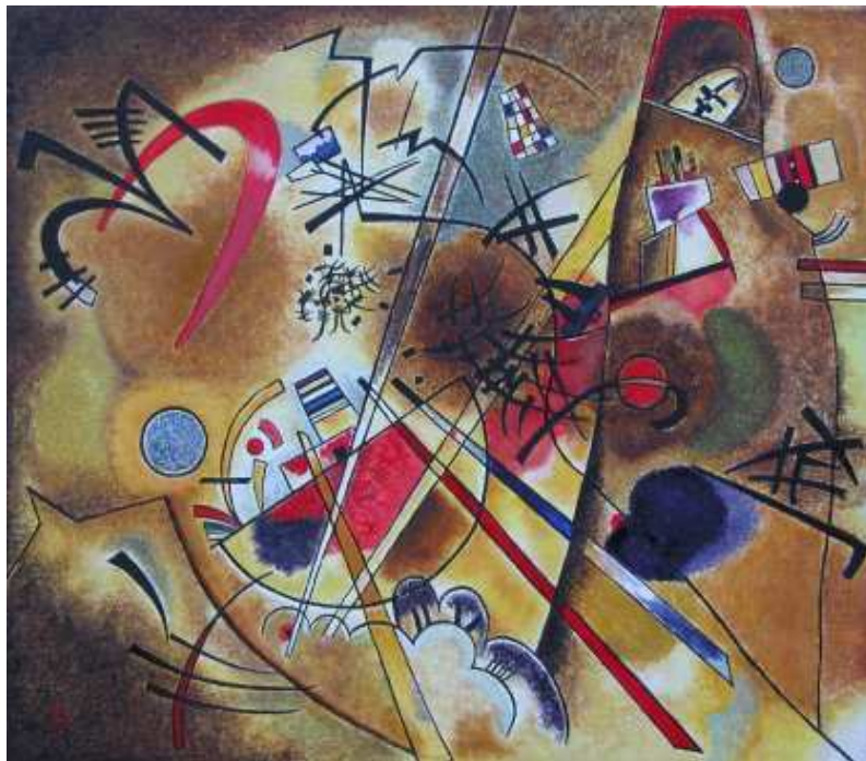
Wassilij Kandinskij, Piccolo sogno in rosso (Kunstmuseum, Berna)

La bellezza della forma ... è ... quella rettilinea e circolare delle figure, piane e solide, che si ottengono mediante compasso, riga e squadra. Perché queste cose sono belle non, ..., in maniera relativa, ma in se stesse e per la loro propria natura (Platone, Filebo).