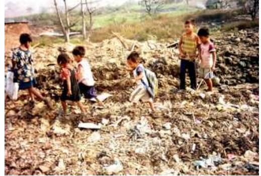
Bambini nelle discariche del “terzo” mondo