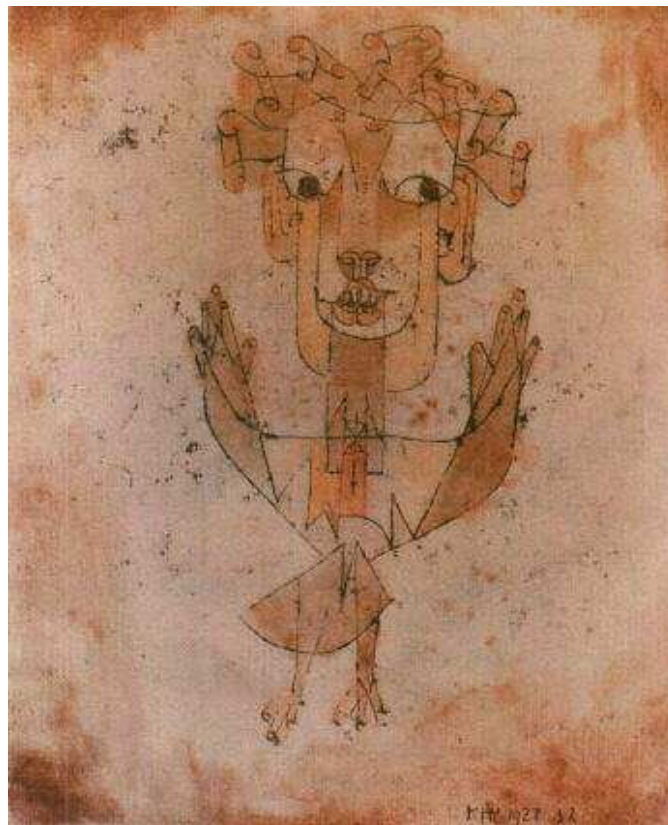
Paul Klee, Angelus Novus (Israel Museum, Gerusalemme)

C'è un quadro di Klee che s'intitola Angelus Novus . Vi si trova un angelo che sembra in atto di allontanarsi da qualcosa su cui fissa lo sguardo. Ha gli occhi spalancati, la bocca aperta, le ali distese. L'angelo della storia deve avere questo aspetto. Ha il viso rivolto al passato. Dove ci appare una catena di eventi, egli vede una sola catastrofe, che accumula senza tregua rovine su rovine e le rovescia ai suoi piedi. Egli vorrebbe ben trattenersi, destare i morti e ricomporre l'infranto. Ma una tempesta spira dal paradiso, che si è impigliata nelle sue ali, ed è così forte che egli non può più chiuderle. Questa tempesta lo spinge irresistibilmente nel futuro, a cui volge le spalle, mentre il cumulo delle rovine sale davanti a lui al cielo. Ciò che chiamiamo il progresso, è questa tempesta (Walter Benjamin, Tesi di filosofia della storia ).