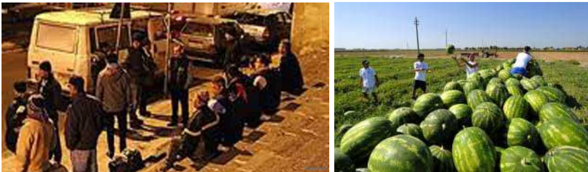
La tratta degli schiavi e gli schiavi al lavoro

Pagano i contribuenti e i lavoratori, sotto forma di aumento delle tasse e/o di contrazione dei salari. Al fenomeno dell'indebitamento si somma quello della "finanziarizzazione". La ricchezza è rappresentata dall'emissione di "titoli" che da semplici indicatori della ricchezza finiscono per diventare ricchezza essi stessi. Una ricchezza letteralmente inesistente ma che costituisce la base di una "taglia" imposta alla comunità dal potere finanziario. Questa taglia è percepita dalle banche e soprattutto da una classe di intermediari finanziari che approfitta della sua posizione "strategica" nelle transazioni finanziarie. È così che il capitalismo industriale basato sulla realtà delle "cose" diventa capitalismo finanziario basato sulla rappresentazione dei "titoli". Il grande salvataggio si traduce ovviamente in un peggioramento della finanza pubblica. Ma diversamente da quello del finanziamento privato, quest'ultimo è punito dalle politiche economiche e finanziarie che colpiscono i "salvatori". Il capitalismo non ammette infatti che il settore pubblico diventi un elemento decisivo dell'economia. Si profila una condizione nella quale il rallentamento della crescita determinato da politiche repressive della finanza pubblica si accoppia con l'iniquità. Due elementi che rischiano di suscitare una depressione di lungo periodo 23 .