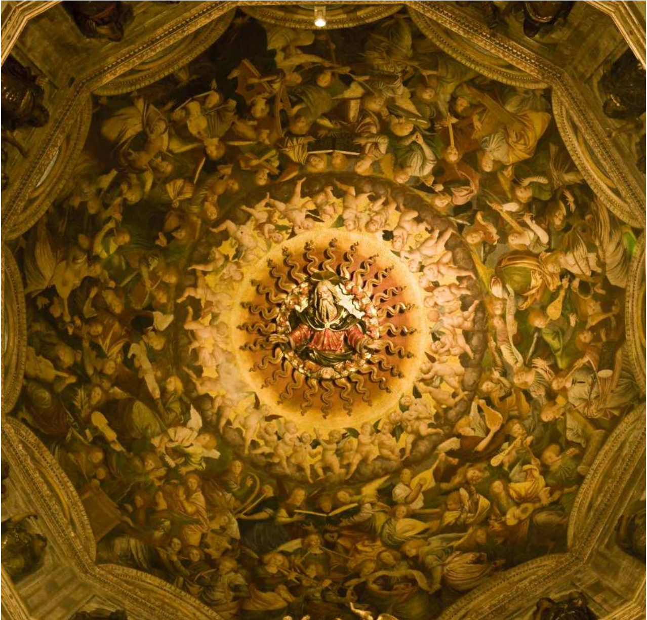
Gaudenzio Ferrari, Concerto degli Angeli (Santuario della Beata Vergine dei Miracoli, Saronno)

La conoscenza umana comincia con le intuizioni, continua con i concetti e finisce con le idee (David Hilbert).