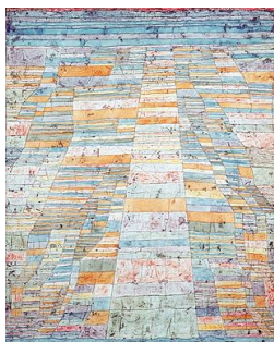
Paul Klee, Strada principale e strade secondarie 70 (Ludwig Museum, Colonia)

Infatti non è possibile numerare, né descrivere con frasi, tutti i numeri reali e, in particolare, tutti i numeri trascendenti, anche se alcuni di loro (ad esempio, \pi , ed il numero e ) sono noti e comunemente descritti con le frasi che li definiscono. Andando oltre i numeri trascendenti conosciuti ed in uso, come molti valori trigonometrici, logaritmici, appartenenti alla funzione gamma, ecc., non sono conoscibili, anche se per l'ipotesi del continuo esistono fino a riempire tutta la retta reale. Per completezza, si ricorda che non esistono infinità comprese tra l'infinità numerabile e l'infinità con la potenza del continuo, mentre sono arcinote altre infinità di ordine superiore, oltre la potenza del continuo (quali i numeri trans-finiti, introdotti da Cantor, di sicuro interesse nella matematica moderna).