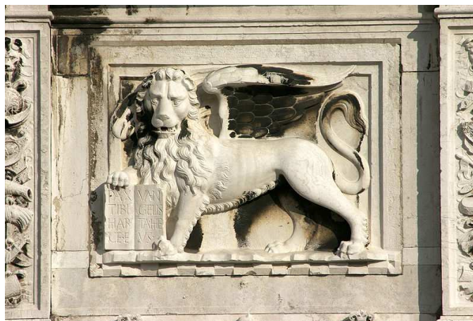
Leone marciano 9 o leone alato

L'uso delle categorie marxiane del materialismo storico 5 serve in primis a storicizzare lo strutturalismo, senza mai cadere nelle trappole ideologiche dello storicismo idealista, e poi ad utilizzare le tecniche offerte dal pragmatismo/funzionalismo e, in particolare, dalla teoria dei sistemi, non come soluzioni indiscutibili (e quasi taumaturgiche), ma come alcune tra le soluzioni possibili, sempre affiancate da tutti i dubbi derivati dalla costruzione delle ipotesi di lavoro. Infatti le basi biologiche della natura umana dotano tutti gli uomini di una sintassi profonda e di alcune categorie matematiche 6 , offrendo importanti strumenti comuni. Tuttavia il portato storico delle varie e diverse società (degli uomini), in particolare, con la natura di classe di tutte queste società, fanno sì che gli esiti possano essere anche molto differenti e la lettura storica del passato, con le ipotesi sulla storia futura, sia costruita, solo a partire dalla moderna condizione sociale, politica ed economica del tardo capitalismo (declinante 7 e purtroppo ancora percorsa da guerre 8 ).