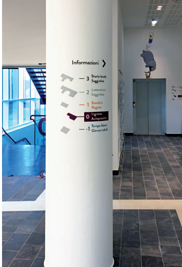
Piano terra, segnaletica di orientamento

Il piccolo segno che poggia accanto al nome della biblioteca (lo chiameremo marchio) serve, invece, a raccontare in maniera più precisa l'identità vera e profonda della biblioteca. Non sempre quel che si mostra fuori è quello