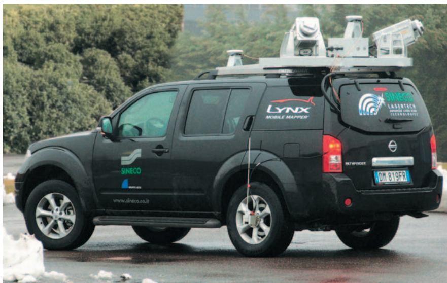
Un Nissan Pathfinder allestito per i rilievi

tenzione e di nuova costruzione ai rilievi con strumentazioni ad alto rendimento per il check-up strutturale/funzionale delle pavimentazioni e per la formazione di Banche Dati stradali georiferite, in collaborazione con la canadese Optech e l'Istituto OGS di Trieste, ha sviluppato una innovativa strumentazione: si tratta del Lynx Mobile Mapper, che rappresenta a tutti gli effetti la nuova generazione di tecnologia laser scanning in quanto rivoluziona completamente le tradizionali metodologie di rilievo. Il Lynx, ideato per la prospezione laser dinamica terrestre, permette infatti di rilevare in movimento il territorio a 360°, ricostruendo in tempo reale tessuto edificato, infrastrutture e ambiente circostante.