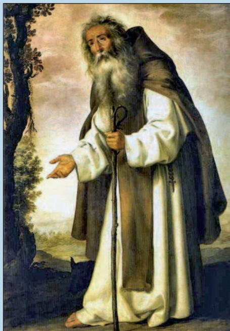
Sant'Antonio da Padova in un dipinto di Francisco de Zurbaràn

L'aggressione di una nave pirata non era un evento così remoto. Nel 1408 una galera veneziana di ritorno dalla Terrasanta fu assalita dai pirati turchi nel golfo di Satalia. Dato che non c'erano armi a bordo i pellegrini dovettero affrontare i pirati in una sanguinosa lotta corpo a corpo in cui ebbero la meglio, evitando così la cattura. Preso atto della situazione di anarchia in cui versava il Mediterraneo, la Repubblica di Venezia stabilì per legge che ogni nave che trasportava pellegrini doveva avere a bordo (a disposizione dei passeggeri oltre che dell'equipaggio) un numero consistente di balestre, frecce e lance. ■