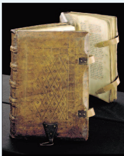
Il tomo originale del Sachsenspiegel

Lo Specchio Sassone è la più rilevante raccolta normativa del Medioevo tedesco. Il nome Specchio Sassone aveva un significato analogico: come si può osservare il proprio volto in uno specchio, così i Sassoni avrebbero potuto vedere in uno specchio ciò che era giusto e lecito e ciò che non lo era. Esso è stato conservato in quattro manoscritti dorati e a immagini e in ben 480 frammenti e manoscritti. Basato fondamentalmente sul Diritto germanico, fu interpretato come un bastione contro la cosiddetta recezione