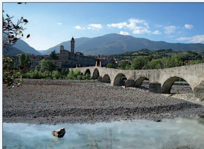
Il "ponte Gobbo" a Bobbio in Val Trebbia

Nelle sue Storie, il monaco benedettino Richer ricorda un viaggio del 991: giunse sul far della sera a Meaux, a una giornata di viaggio da Parigi. Esaminando il ponte sulla Marne, fu assalito da alcune preoccupazioni: "I buchi che si aprivano su di esso erano tali e tanti che nemmeno gli abitanti del posto quel giorno lo attraversavano". Il suo prudente compagno cercò inutilmente una barca e infine "rischiò la traversata sul ponte e con l'aiuto del cielo riuscì a portare i cavalli sani e salvi dall'altra parte. Nei punti dove c'erano i buchi egli mise sotto i loro zoccoli il suo scudo e alcune tavole e, un po' curvo, un po' eretto, un po' avanzando, un po' retrocedendo giunse finalmente dall'altra parte con me". La storia di Richer dimostra che si doveva provvedere in continuazione alla manutenzione dei ponti, se si voleva davvero agevolare la circolazione e consentire a uomini e ad animali di giungere incolumi sull'altra riva.