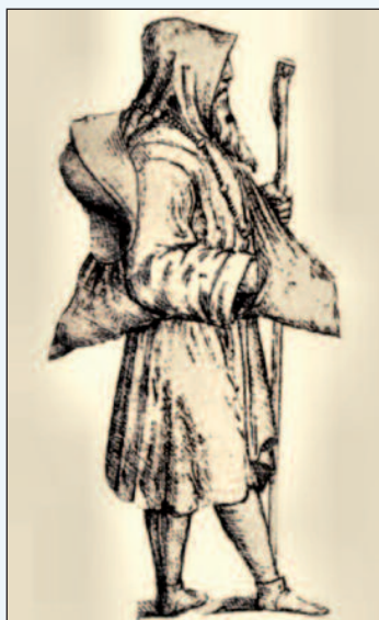
Un'antica rappresentazione del pellegrino

Eppure il Medioevo, lungo le strade della fede, conteneva già le premesse dell'innovazione commerciale che portò alla rivoluzione economica e politica del primo Rinascimento. Fu proprio la vasta rete di collegamenti umani e religiosi a sostenere e sviluppare quell'identità culturale europea che caratterizza il trapasso dai secoli bui.