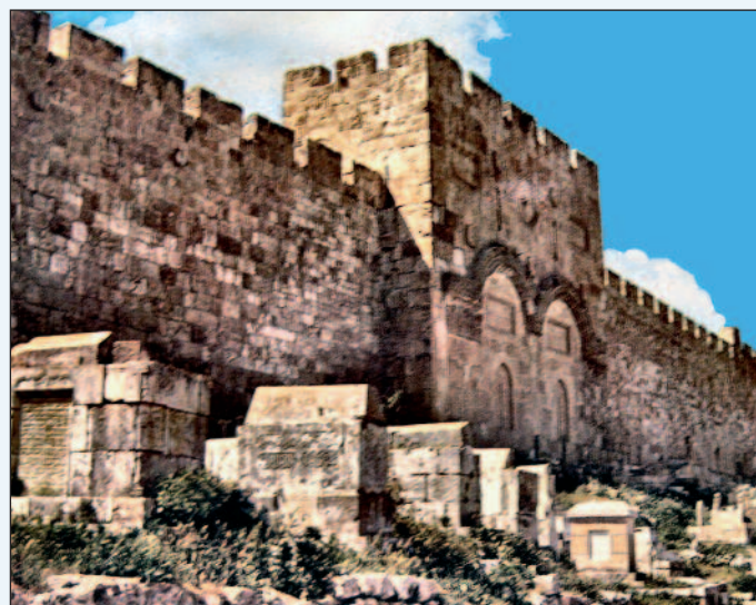
Le sepolture presso le mura di Gerusalemme nei pressi della Porta d'Oro