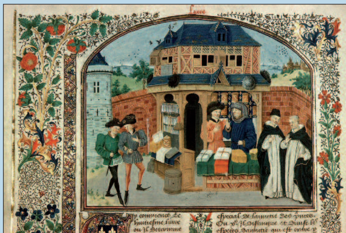
Fra i pellegrini e mercanti in una miniatura

La maggior parte dei pellegrini doveva però trovare alloggiamento con un vocabolario costituito da poche parole. Se era possibile, i viaggiatori stranieri cercavano ospitalità presso locande di conterranei emigrati all'estero. Il Fondaco dei Tedeschi a Venezia fu una meta nota per i commercianti sassoni che si recavano in questa città.