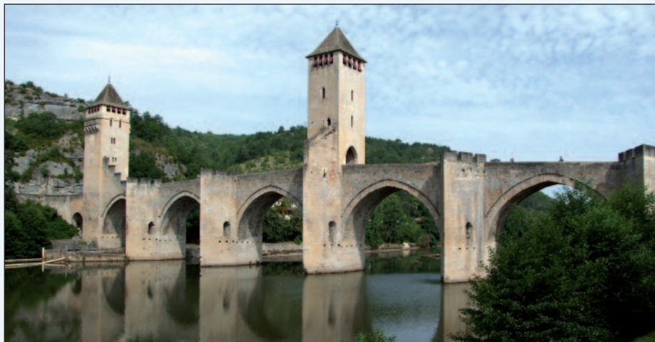
Il ponte fortificato a Cahors

Dall'XI al XII secolo fu costruito un numero sorprendente di ponti per ragioni economiche, militari o altruistiche: le considerazioni di profitto miravano a un incremento del commercio e del traffico; ponti e teste di ponte venivano inclusi negli apparati di difesa della città. Nell'Alto Medioevo però la costruzione di ponti appare un'opera caritatevole, come l'ospizio per i forestieri o il riscatto dei prigionieri. Nel 1130 il Conte von Blois fa costruire un ponte sulla Loira per la salvezza della sua anima. Come logica conseguenza, la gente si sentì spinta a destinare per testamento parte delle proprie sostanze alla costruzione di ponti: così, con i lasciti, furono finanziati numerosi ponti.