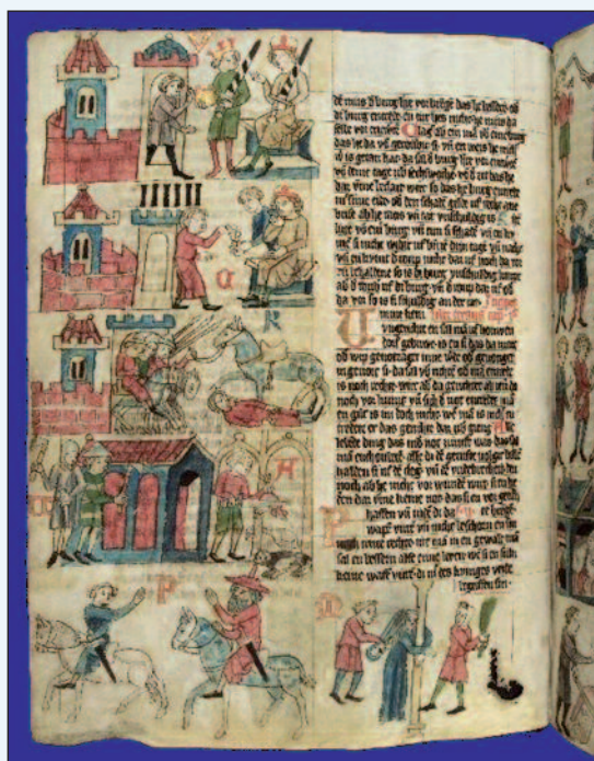
Una pagina miniata del Sachsenspiegel