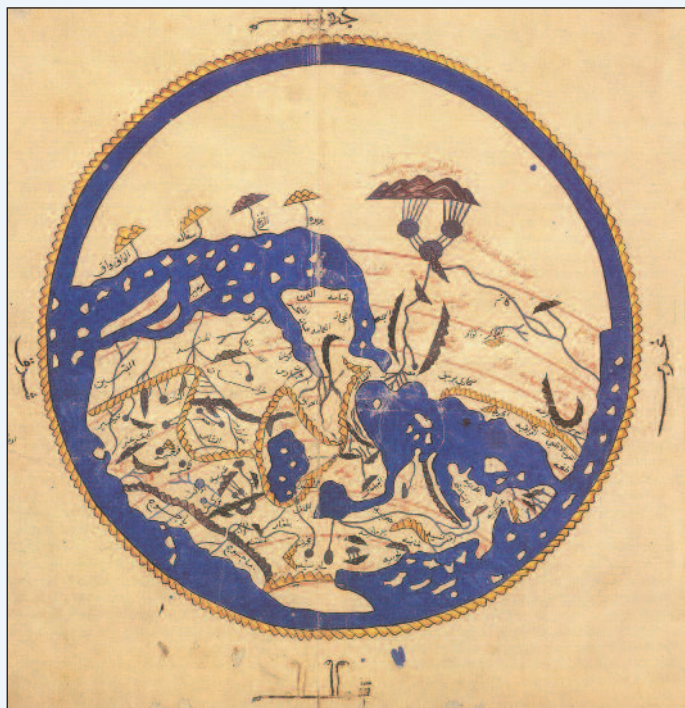
Una cosmografia medievale

mare. Gli armatori veneziani, come la famiglia Contarini, misero insieme vere e proprie fortune con il "turismo religioso" del tempo. Gli armatori provvedevano anche a prendere contatti con le autorità arabe locali, anche se gli accordi non venivano sempre rispettati e il costo delle traversate poteva essere ritoccato in modo arbitrario. Le cronache di viaggio sono concordi nel consigliare l'imbarco a Venezia. Per molti motivi di ordine pratico, le partenze erano numerose, la flotta scortava per gran parte del viaggio le navi che trasportavano i pellegrini e gli scali veneziani erano abbastanza protetti dalle incursioni dei pirati. Probabilmente a vantaggio di Venezia giocava anche la stabilità della moneta, il ducato, che veniva accettato correntemente anche dagli Arabi. Il ducato d'argento era il nome di un "grosso" emesso a Venezia per la prima volta dal Doge Enrico Dandolo intorno al 1202 (in seguito fu detto Matarpan): su un lato San Marco che consegna la bandiera al Doge, sul rovescio Cristo in trono. Il ducato d'oro fu emesso per la prima volta nel 1284 dal Doge Giovanni Dandolo (1280-1288) e in seguito prese il nome di Zecchino. Il ducato veneziano presentava il Doge che si inginocchia davanti a San Marco e sul rovescio Gesù Cristo dentro la "mandorla" e l'iscrizione " Sit tibi Christe datus quem tu regis iste ducatus ".