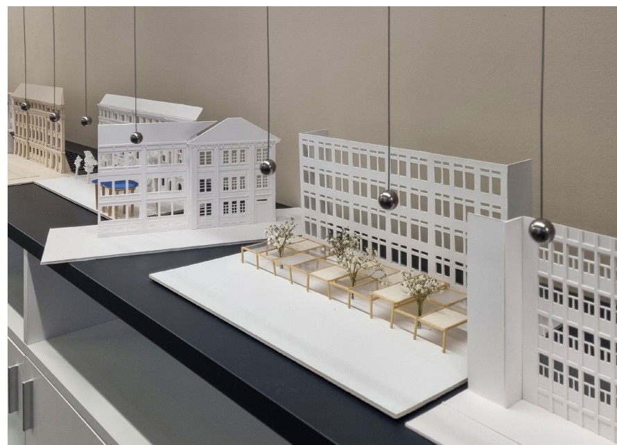
05.11.2025: Giornata di Studi. Approfondimenti e modelli di edifici scolastici milanesi