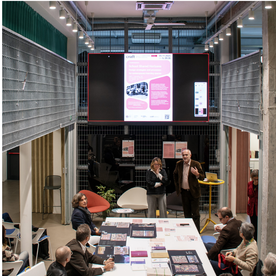
05.11.2025: Giornata di studi e tavola rotonda