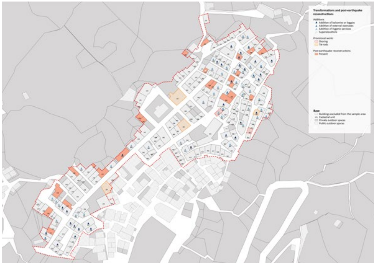
Figura 3. Analisi delle trasformazioni e degli interventi post-sismici del piccolo abitato di Ferruzzano superiore, Reggio Calabria (elaborazione M. Scaglia, C. Valiante, da SCAGLIA, VALIANTE 2024, p. 313).