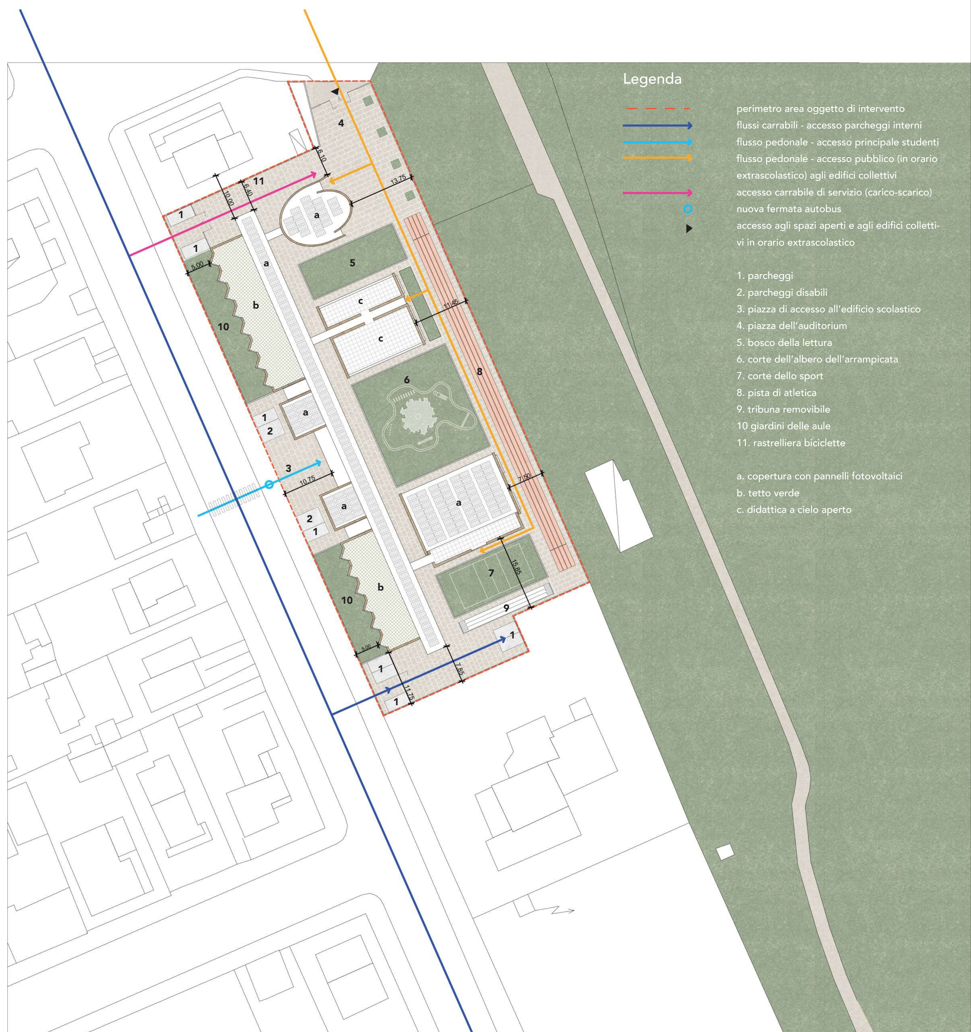
Planimetria generale stato di progetto scala 1:500