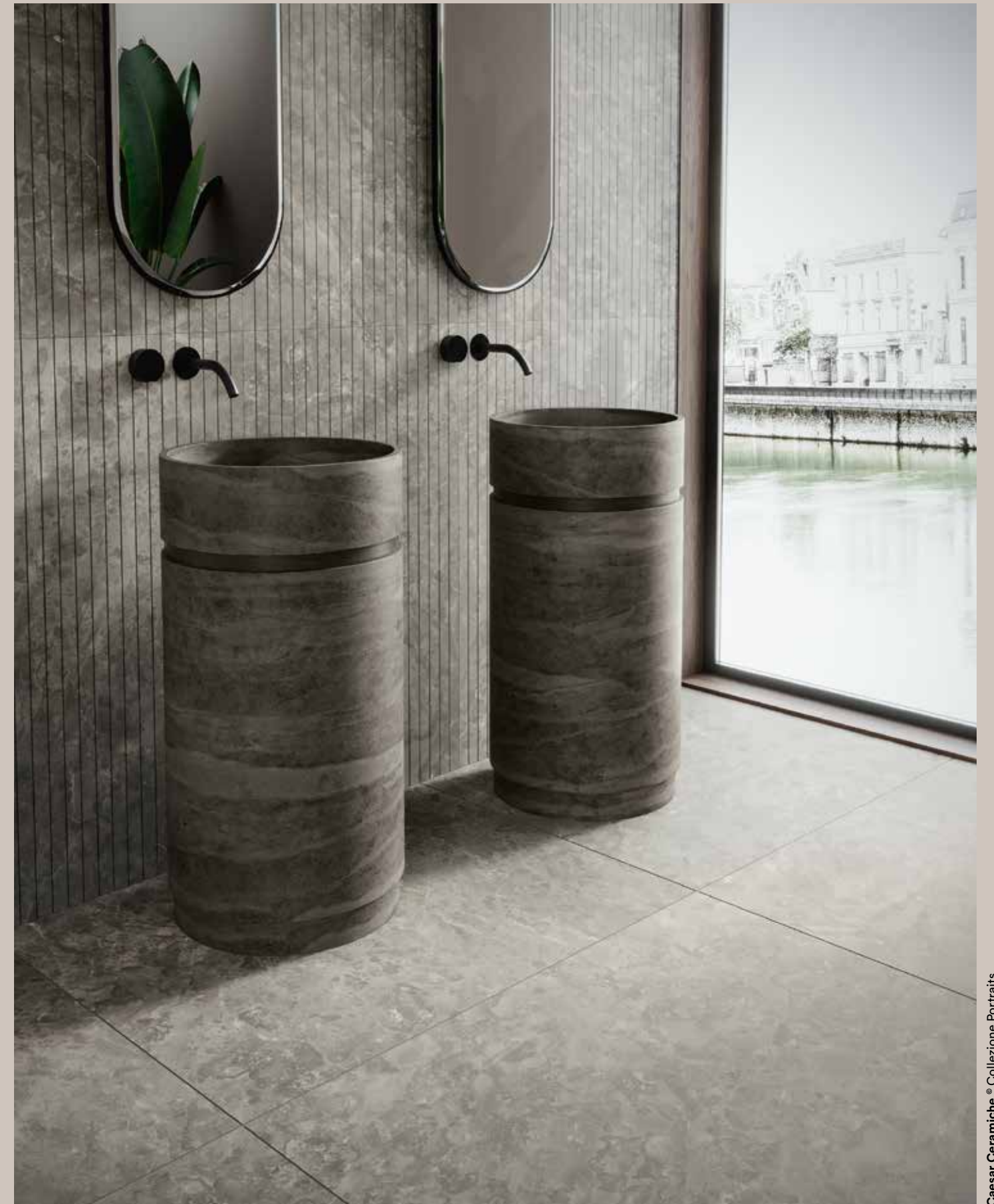
Caesar Ceramich® Collezione Portraits.

La nostra ceramica, fonte d'ispirazione che genera design sostenibile, progetti, emozioni. Materia viva che nutre le tue visioni.