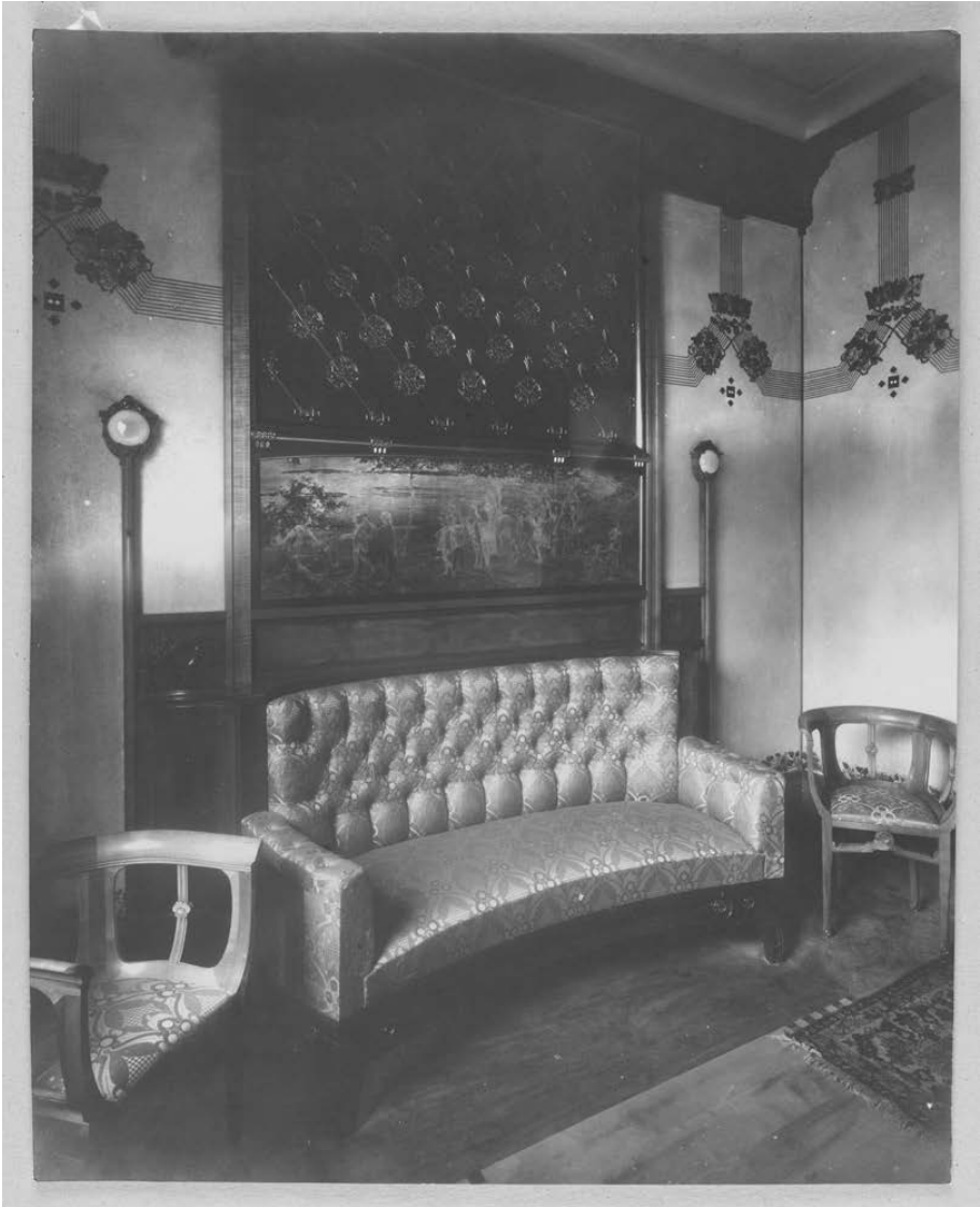
Fig. 3: Anonyme, Exposition de Milan. Manufacture Quarti. Salon en érable , 1906. Milan, Civica Raccolta delle Stampe "Achille Bertarelli", Fond Eugenio Quarti, Photographie 193. © Tous droits réservés.