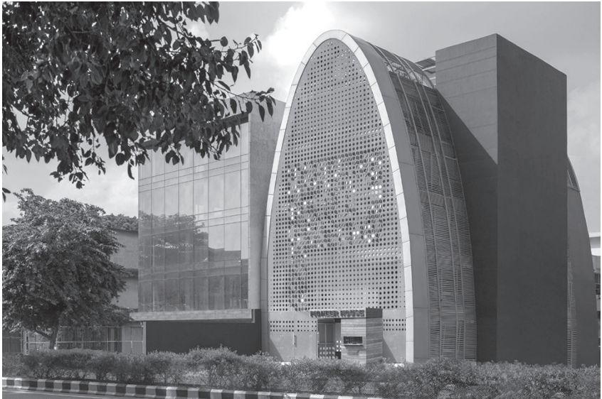
Fig. 4 The Digit, Delhi.