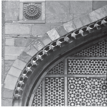
Fig. 1a Qutb Minar, Delhi, dettaglio arco d'importazione islamica.