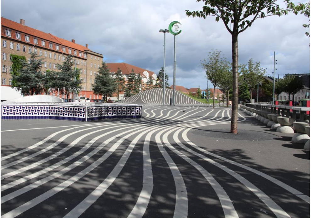
Fig.02 Superkilen, Copenhagen.

perando la media urbana del 10%. Copenhagen è la sede del Superkilen Park, che rappresenta un esempio innovativo di spazio urbano che integra diversità culturale, promozione dell'attività fisica e accessibilità attraverso un approccio partecipativo. I progettisti hanno inserito percorsi ciclabili e pedonali con pavimentazioni differenziate per stimolare l'attività motoria e nello stesso tempo per fornire riscontri tattili, aree attrezzate per diverse pratiche sportive destinate a utenti con diverse abilità, spazi gioco con attrezzature accessibili, elementi di arredo urbano derivanti da processi partecipativi che rispondono a esigenze diverse. Il luogo così rigenerato ha dato come risultati un incremento nell'utilizzo dello spazio, una diversificazione significativa dell'utenza, per abilità, età, etnia e genere, un aumento dell'attività fisica giovanile e una riduzione degli episodi di vandalismo. Un esempio italiano porta a Milano con il Parco Biblioteca degli Alberi, caratterizzato da una progettazione integrata che unisce percorsi attivi, accessibilità universale, cultura e vegetazione. Il parco include orti accessibili, aree gioco inclusive, spazi per l'attività fisica spontanea e percorsi sensoriali, garantendo un'elevata qualità dell'accessibilità e un'ampia varietà delle attività possibili, così come riconosciute dal grande numero di utenti.