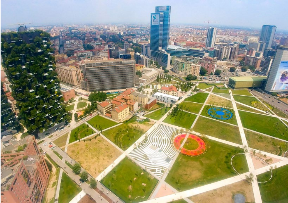
Fig.03 Parco Biblioteca degli Alberi. Milano.

è la progettazione partecipata attraverso il coinvolgimento di tutta la comunità locale, così da potenziare le sinergie, limitare i conflitti di interesse e garantire che le soluzioni spaziali riflettano i bisogni reali.