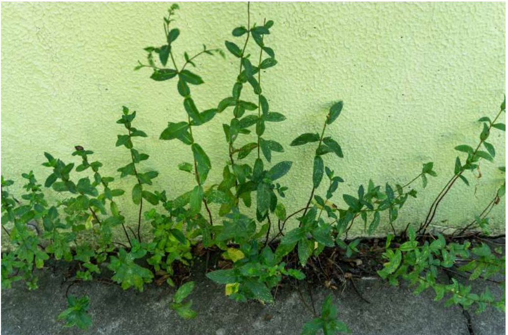
Fig. 9 Paolo, Casa Di Reclusione Milano-Opera