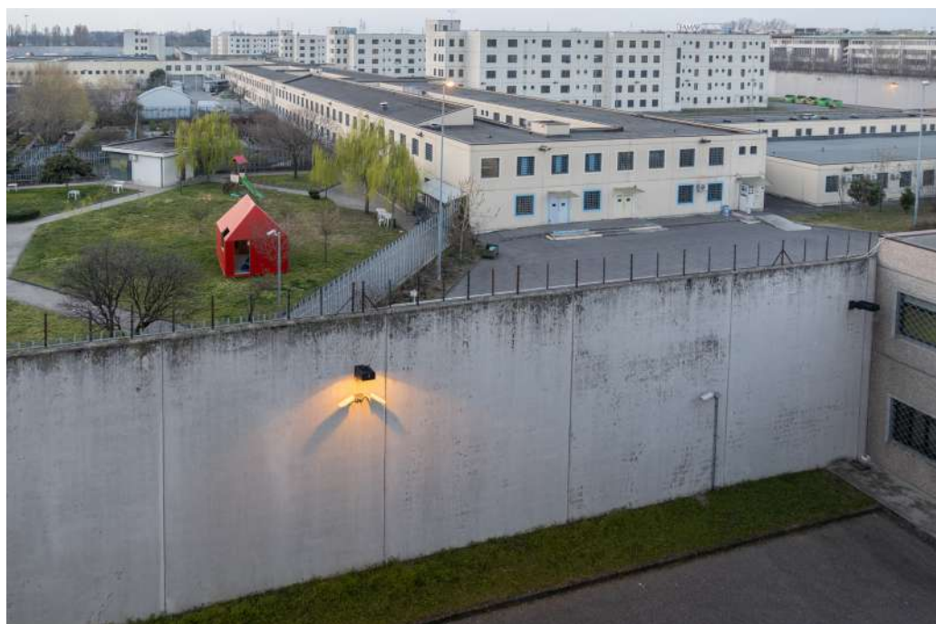
Fig. 6 Arnaldo Pedara, Seconda Casa Di Reclusione Milano-Bollate