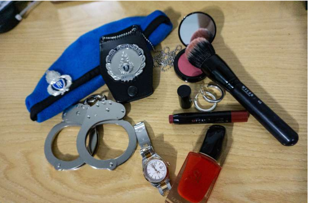
Fig. 3 Ilaria De Pascale, Istituto Penale Minorile di Milano "Beccaria"