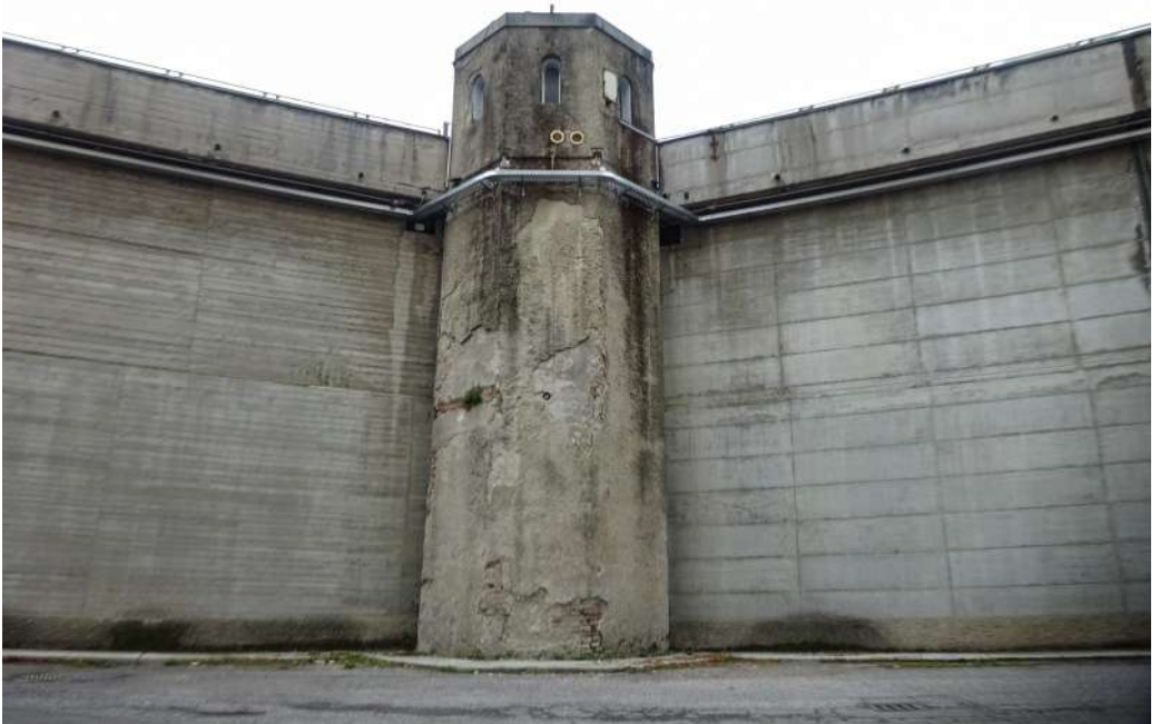
Fig. 11 Angiolino Candreva, Casa Circondariale di Milano "San Vittore" – F. Di Cataldo