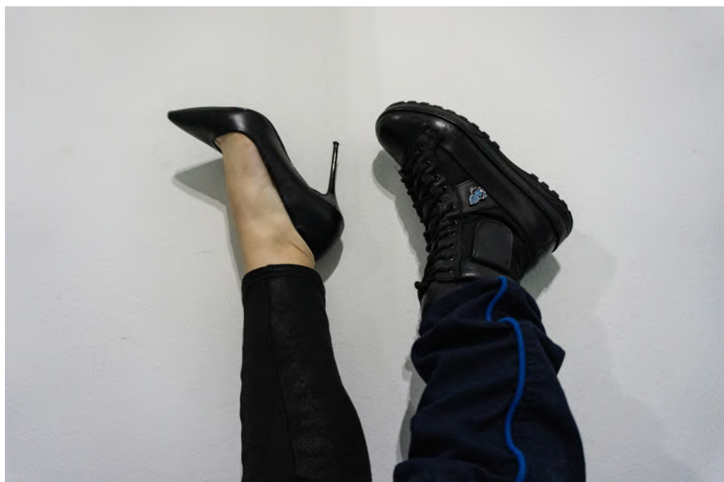
Fig. 4 Ilaria De Pascale, Istituto Penale Minorile di Milano "Beccaria"