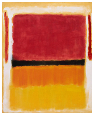
Fig. 1: Mark Rothko, (Dvinsk, Russia, 1903, New York, 1970), Untitled (Violet, Black, Orange, Yellow on White and Red) , 1949, Oil on canvas, 207 x 167.6 cm. Solomon R. Guggenheim Museum, New York Gift, Elaine and Werner Dannheisser and The Dannheisser Foundation, 1978.

Non giustapposizione ordinata di specificità funzionali e spaziali, ma prossimità dialoganti di variazioni in parziale interferenza, generatrice di luoghi incerti, potenziali, dall'identità cangiante, definita solo nel suo uso specifico: non uno spazio dato, ma uno spazio che si fa.