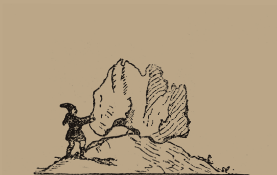
Pietra ballerina di Nuoro. A. La Marmora, Voyage en Sardaigne.