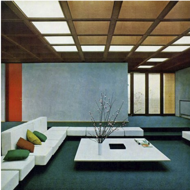
Vista del soggiorno di Villa Carlevaro, presentata in "Domus", 496, marzo, 1971, p. 23.