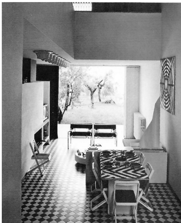
Vista del soggiorno di una delle Ville gemelle.