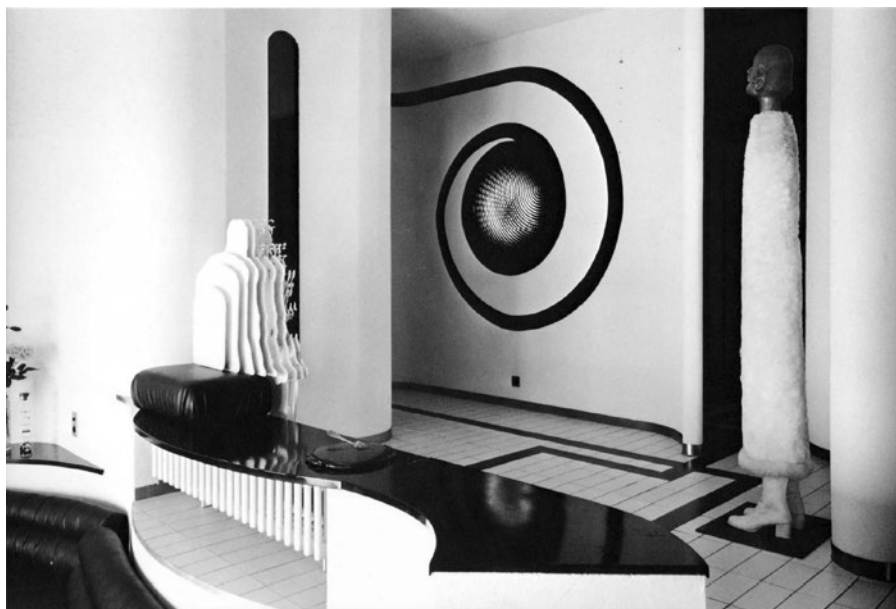
Vista dell'atrio di Villa Fontana. Villa Fontana presentata in "GI-Global Interiors. Houses in Southern Europe 2", 8, 1974, p. 110