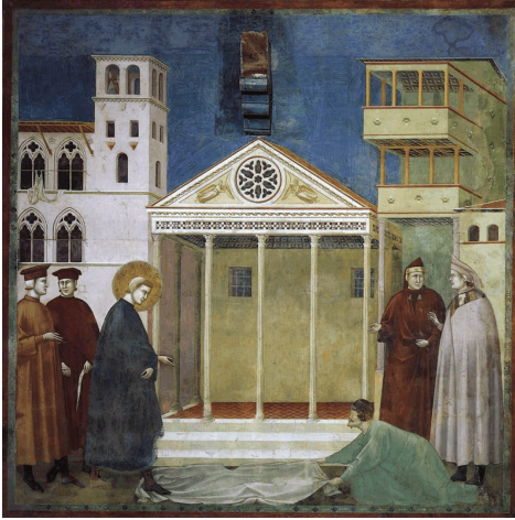
Omaggio dell'uomo semplice Homage of the simple man

rispetto – semplicità – valore respect – simplicity – value