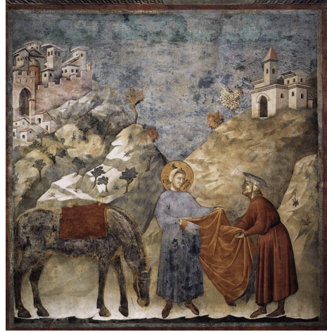
San Francesco dona il mantello a un povero St Francis gives his cloak to a poor man

[Bonaventura da Bagnoregio, Legenda maior , I, 1]