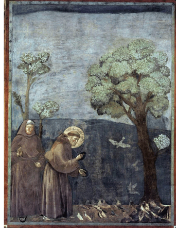
Predica agli uccelli Preaching to the birds

[Bonaventura da Bagnoregio, Legenda maior , III, 10]