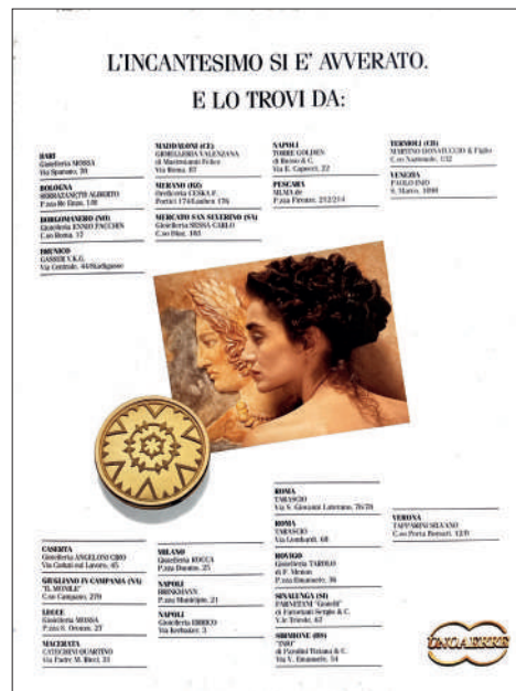
4. Pubblicità UnoAErre, da “FMR”, n. 67, dicembre 1988

autore delle immagini per le sue collezioni e campagne pubblicitarie, pubblicate anche sulla rivista “FMR” – sensibile al tema etrusco e nota per i suoi raffinati cortocircuiti visivi tra antico e moderno (figg. 3-4). Per la comunicazione, UnoAErre si avvale dell’agenzia fiorentina AdMarCo, la stessa che curò anche la promozione del “Progetto Etruschi”.