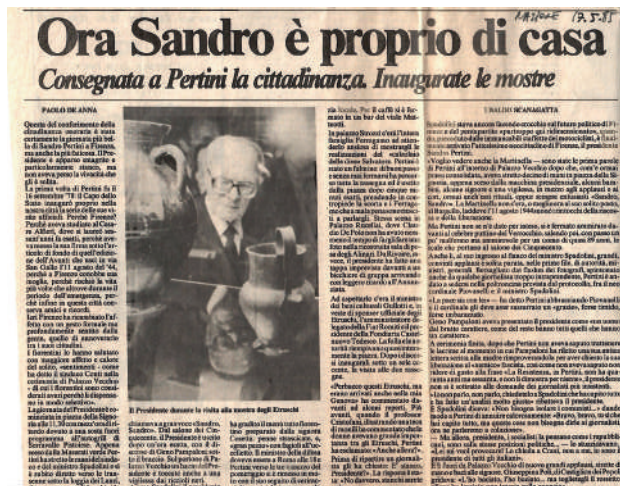
1. Articolo su “La Nazione” del 17 maggio 1985, conservato all’interno della rassegna stampa del “Progetto Etruschi”

fiorentine afferenti al “Progetto Etruschi”, fra le otto disseminate attraverso la regione, nei musei simbolo delle peculiarità archeologiche proprie ai territori di riferimento 2 . Uno sforzo di coinvolgimento territoriale sincronico, orientato alla più ampia sensibilizzazione, che pose al centro di ogni mostra i temi precipi legati alle nuove acquisizioni scientifiche, alle ricerche in corso e ai musei restaurati, riallestiti o sviluppati per l’occasione. Come scrive in questo volume Valentina Belfiore, tutto ciò si collocava nel solco della continuità con il passato degli studi, per quanto recente, per una scienza giovane come l’etruscologia scientifica o accademica 3 . L’apertura delle otto esposizioni costituiva dunque un tassello fondamentale, ma non conclusivo, di una complessa e capillare impresa volta a rilanciare questa disciplina, consolidatasi, nel trentennio precedente, sotto l’egida di Massimo Pallottino. Lo studioso ne aveva gettato le basi attraverso ricerche, pubblicazioni e un’internazionale mostra itinerante che ebbe in Italia una luminosa tappa a Palazzo Reale di Milano nel 1955 4 – per la quale va sottolineata la collaborazione con Luciano Baldessari nella realizzazione degli allestimenti 5 . Non va scordato, inoltre, il solido asse di studi sviluppato in collaborazione con le