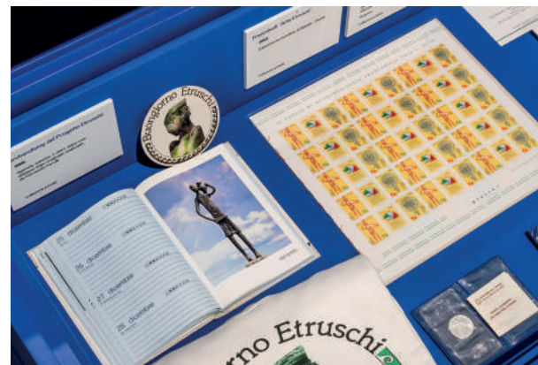
2. Allestimento della mostra Anima Etrusca / Etruscan Soul. La fortuna del Progetto Etruschi . Particolare della vetrina che espone alcuni dei gadget realizzati: magliette, adesivi e perfino diari scolastici