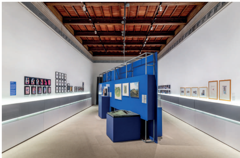
6. Allestimento della mostra Anima Etrusca / Etruscan Soul. La fortuna del Progetto Etruschi

L'uso innovativo, inoltre, della tecnologia – dai tapis roulant sotterranei pensati per il Museo Archeologico di Firenze ai computer che traducevano su richiesta dei visitatori frasi in Etrusco nella mostra Civiltà degli Etruschi – completava l'esperienza, anticipando pratiche museografiche e di mediazione culturale oggi consolidate. L'attenzione alla comunicazione massificata per veicolare e disseminare contenuti culturali è divenuta una costante della contemporaneità ed ebbe proprio con il 1985 un incredibile trampolino di lancio. La rassegna stampa (lunga 16 km di carta!) testimonia oggi le tecniche usate allora per ottenere una diffusione capillare delle iniziative 46 . Il dialogo tra antico e contemporaneo conobbe nel 1985 un momento di grande fortuna, evocato anche nella mostra del 2025 (fig. 6): le installazioni contemporanee – dai Teatrini poetici di Fausto Melotti, microinterni domestici fatti di terracotta 'etrusca', alla neoantica città dei morti immaginata da Arnaldo Pomodoro (cat. 48-51) – dialoga come allora con i reperti, come L'Arringatore , puntualmente richiamato dall' Etrusco di Michelangelo Pistoletto, creando cortocircuiti inattesi. Non potevamo non porre attenzione alla fotografia e al video ampiamente presenti nel “Progetto”: la rassegna di elaborazioni con le pellicole Polaroid di 20 artisti che avevano seguito la serie su carta di Paolo Gioli avviata già nel 1984,