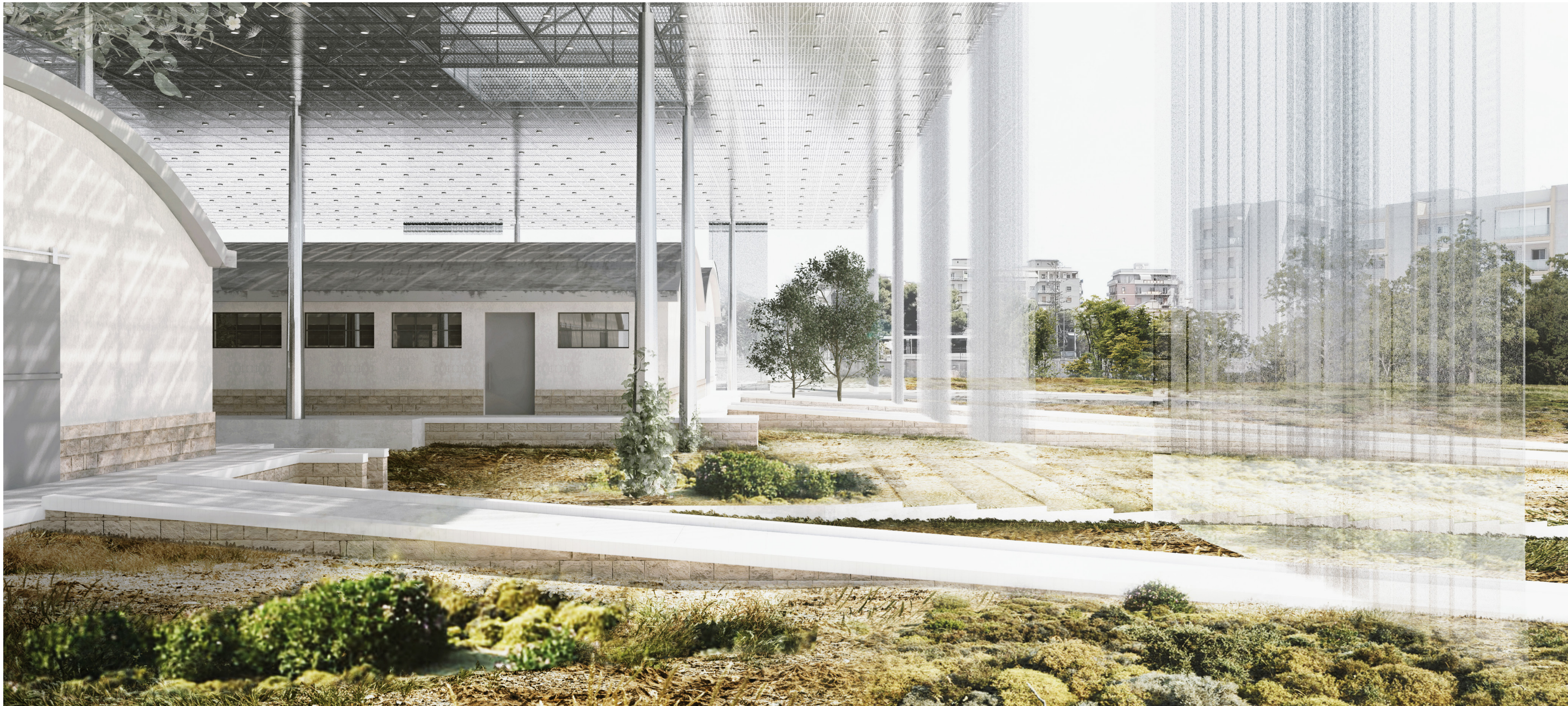
VISTA DELLA GRANDE COPERTURA IN RAPPORTO CON IL PAESAGGIO CIRCOSTANTE. LA GRANDE COPERTURA SI LIBRA SUL PAESAGGIO E DEFINISCE UNA TRANSIZIONE FLUIDA SENZA SOLUZIONE DI CONTINUITÀ TRA L'INTERNO E L'ESTERNO. IL GIARDINO MEDITERRANEO CIRCONDA GLI EDIFICI SOSTENENDO E VALORIZZANDO LA BIODIVERSITÀ LOCALE