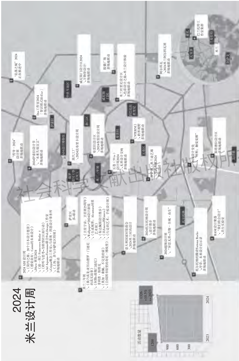
图 1 2024 米兰设计周活动分布情况图