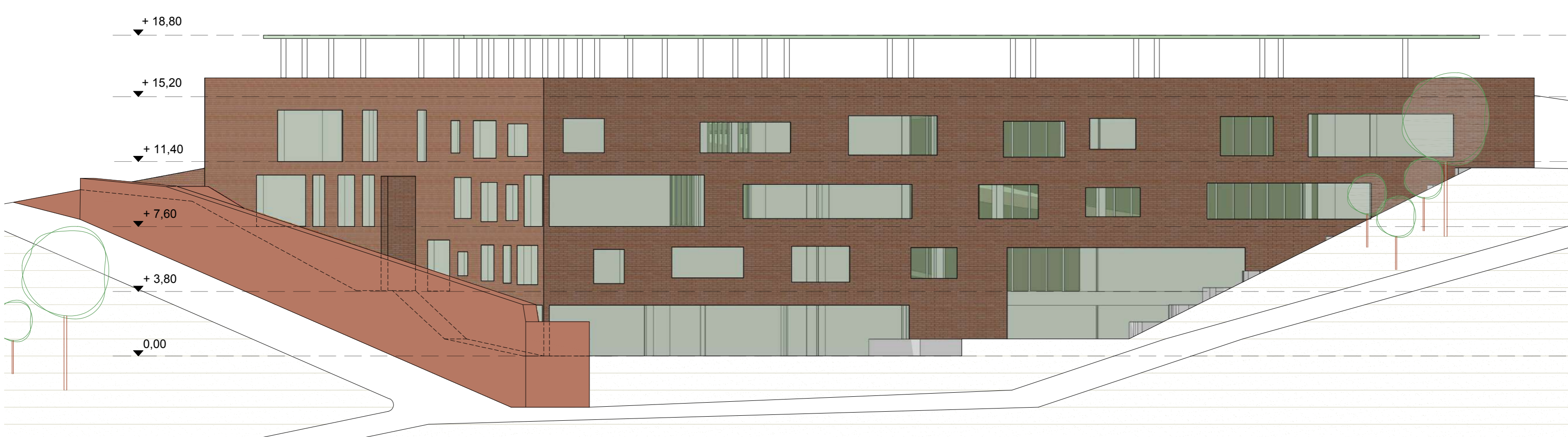
PROSPETTO SUD-OVEST scala 1:200